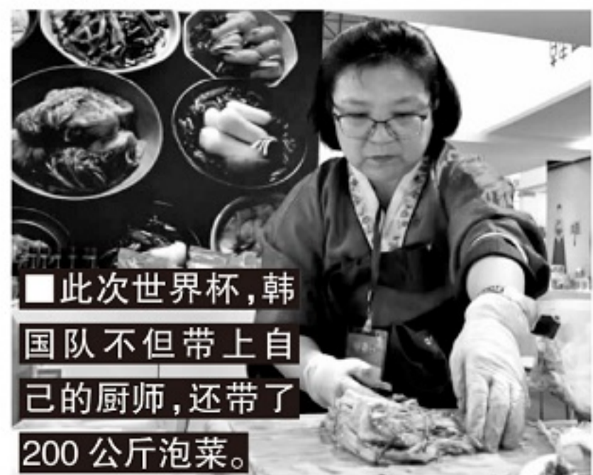
■此次世界杯,韩国队不但带上自己的厨师,还带了200公斤泡菜。