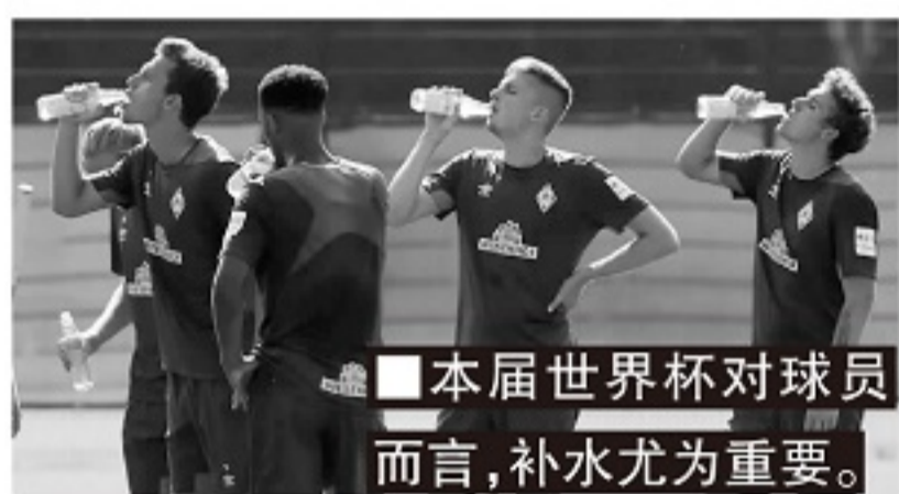
■本届世界杯对球员而言,补水尤为重要。

相比欧美球员此前非常熟悉的西式职业餐,卡塔尔世界杯可能会让他们在一定程度上做出改变。运动医学专家的研究表明:顶级球员场均消耗1107卡路里的热量,两场比赛之间的训练总计消耗量在3442-3824卡路里之间。在卡塔尔的轻高温和重湿度环境下,球员的热量消耗将更大,当然远远超过日常身体代谢的消耗量。因此,卡塔尔世界