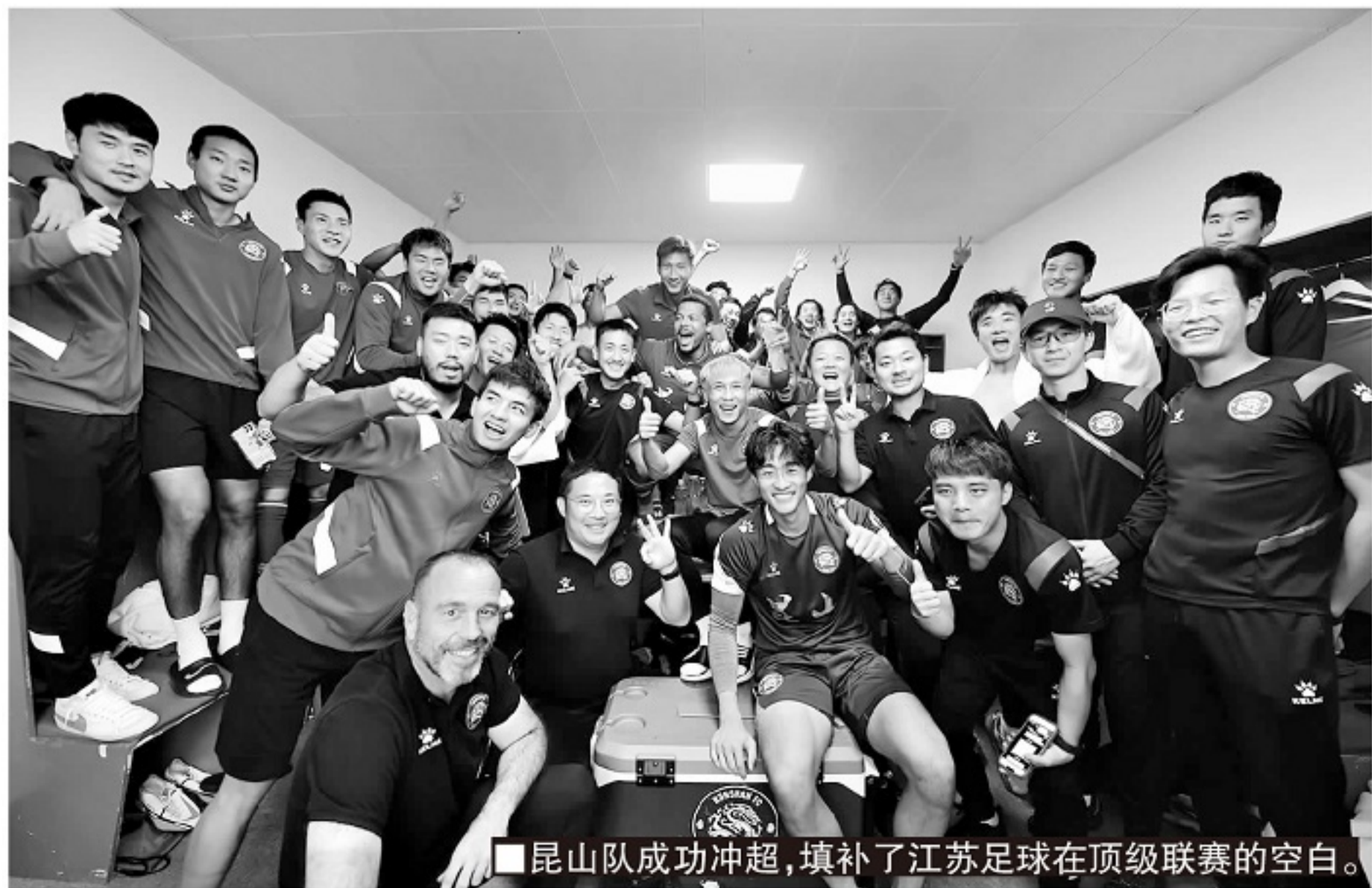
■昆山队成功冲超,填补了江苏足球在顶级联赛的空白。