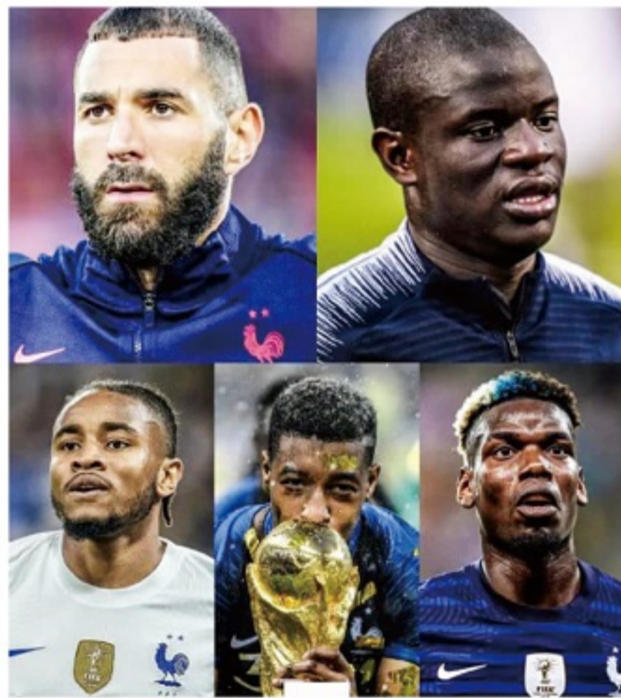
■世界杯开始前,法国队连续损兵折将,今年的“金球先生”本泽马就在备战时受伤而无缘卫冕征程。

到放松缺乏专注,这通常就会爆冷,因此不会在赛事中停留太长的时间。”按照温老爷子的意思,法国队伤缺如此多关键球员,甚至在某种程度上是对球队的正刺激。因为对于现有的球员来说,他们会重新高度紧张起来,专心于去填补球队的空缺,这样一来,卫冕之路,在某种意义上变成了一次新的争冠征程。