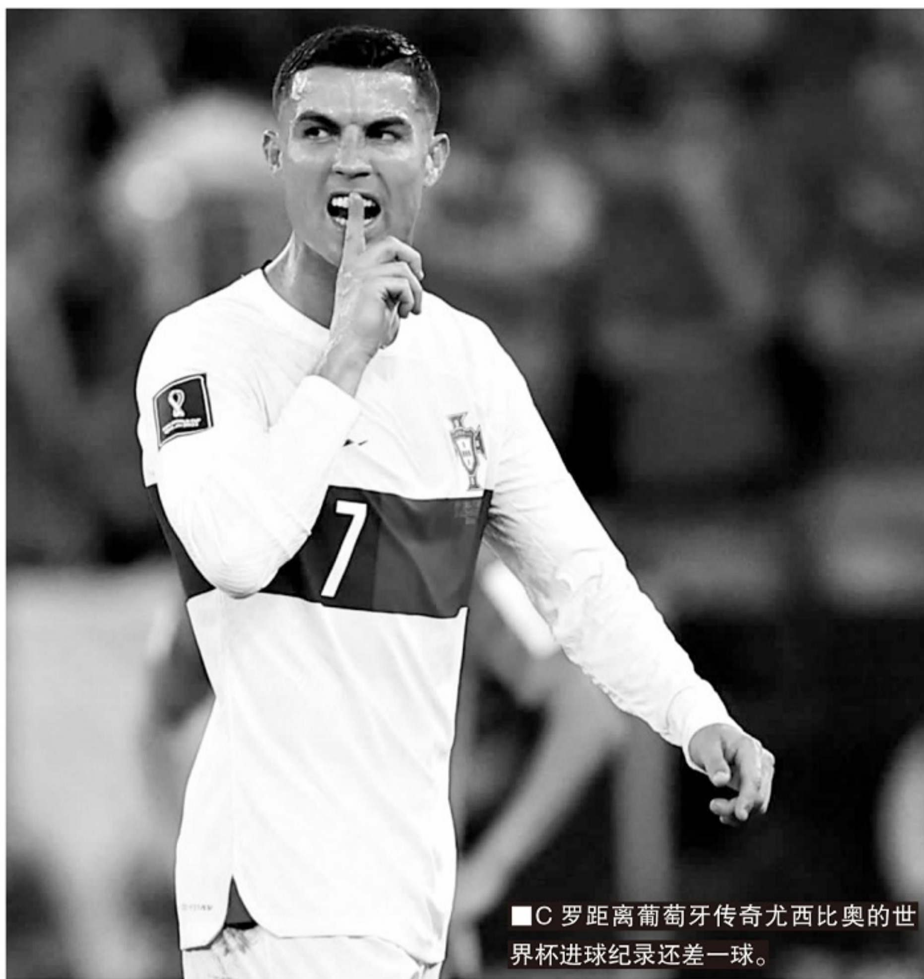
■C 罗距离葡萄牙传奇尤西比奥的世界杯进球纪录还差一球。

身并不稳固的防线所要面对的压力。当然,这也让身体状态已经不在巅峰期的 C 罗很难在与对方强壮的中卫对抗下获得足够多的射门机会,三场比赛,C 罗一共只获得了 8 次射门机会,场均不到 3 次。