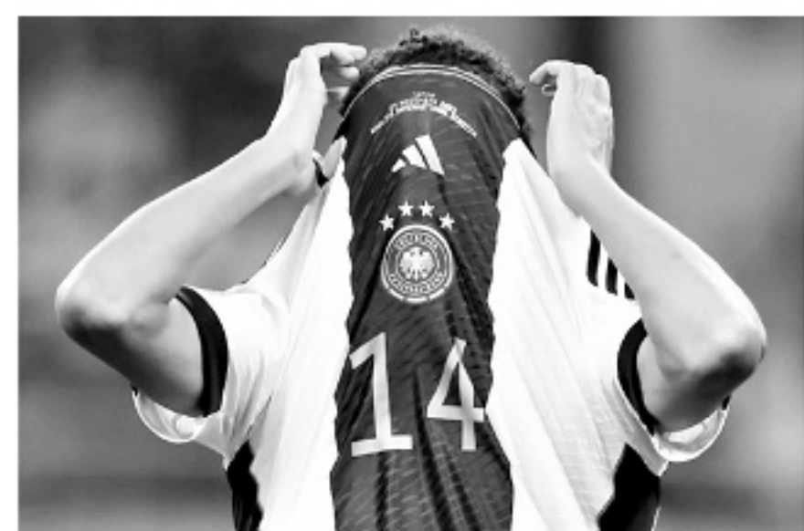
穆西亚拉是德国的未来,可他本身就是一个充满不确定因素的年轻人。

2022年,19岁的穆西亚拉已经是德国国家队征战世界杯的一员,并且3场比赛全部首发,虽然只有一次助攻,但全世界都看