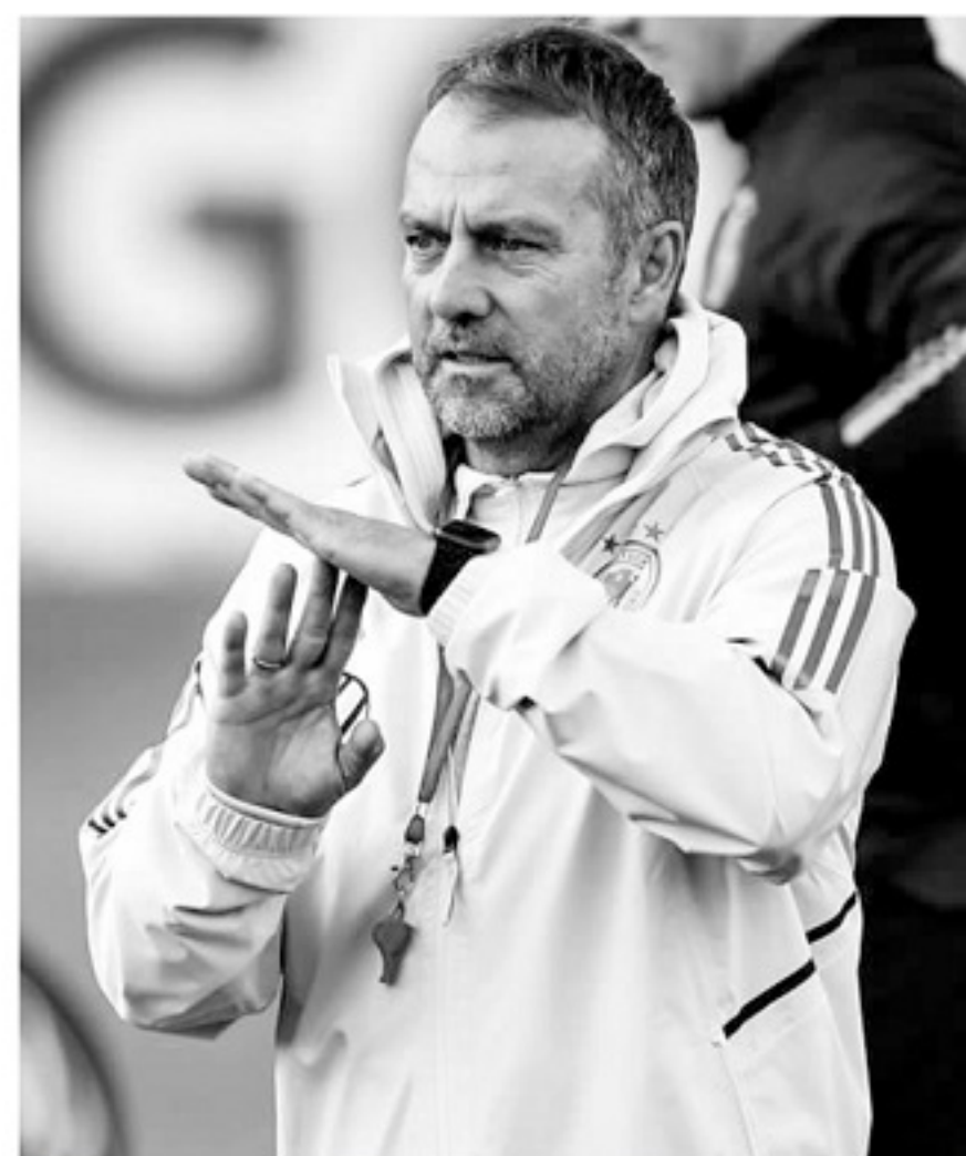
弗里克需要时间,他需要冷静思考德国的未来。

2021年9月,弗里克正式成为德国主帅,当月的国际比赛日,土耳其1比6惨败于荷兰脚下,世预赛出线前景堪忧,土耳其足协聘请昆茨出任主帅,签约3年。昆茨接手土耳其后,差一点力挽狂澜——他率队3胜1平,让土耳其获得了参加欧洲区最后附加赛的资格,不过新月军团最终1比3负于葡萄牙而无缘卡塔尔之旅。昆茨在执教土耳其的同时,也挖了德国的墙角,今年3月,之前一直为德国U系列效力的厄兹詹正式代表土耳其国家队登场,而这名后腰作为昆茨的爱将,在本赛季转会多特