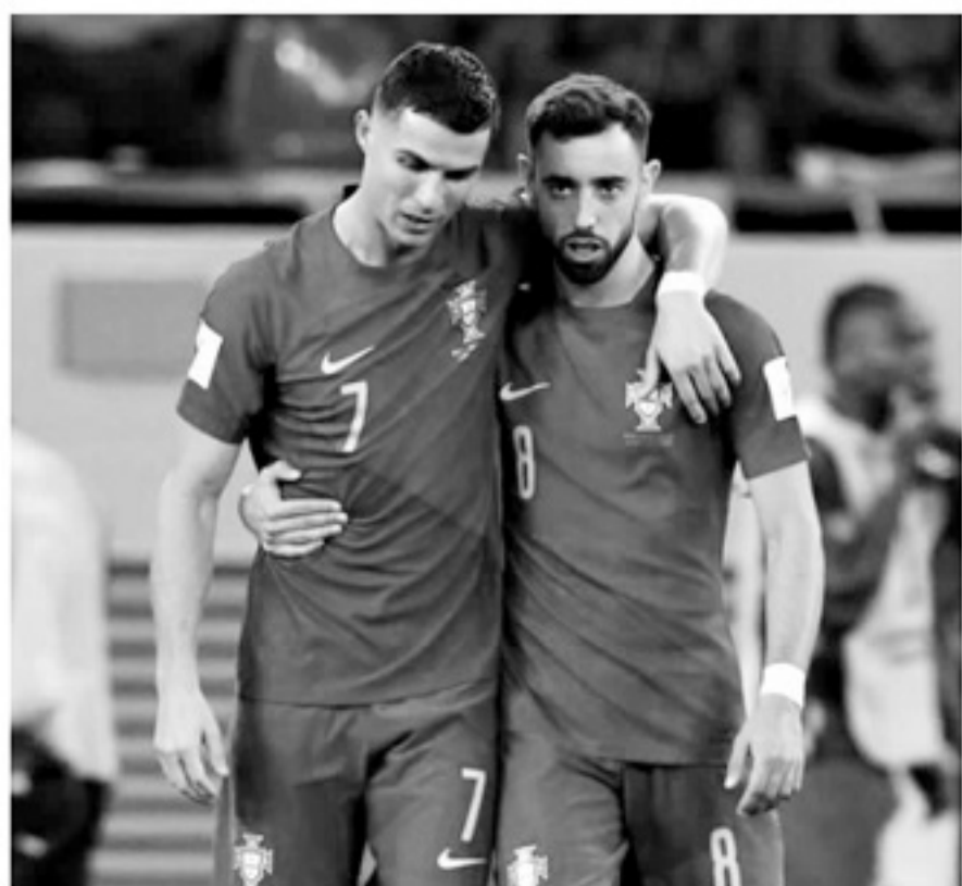
■B·费尔南德斯已经取代 C 罗成为球队的战术核心。

在他的带领下,葡萄牙的战术逐渐开始转变,从曾经强悍的边路进攻,转变为控制中路和肋部打击相结合的更为符合现代足球战术的体系。三场小组赛,葡萄牙的总传球次数达到 1838 次,其中成功传球 1631 次,传球成功率为 88.7%。相比之下,葡萄牙的传中总次数只有 55 次,成功传中只有 14 次。这样的进攻方式,能够让葡萄牙牢牢掌握比赛的主动权,缓解自身并不稳固的防线所要面对的压力。