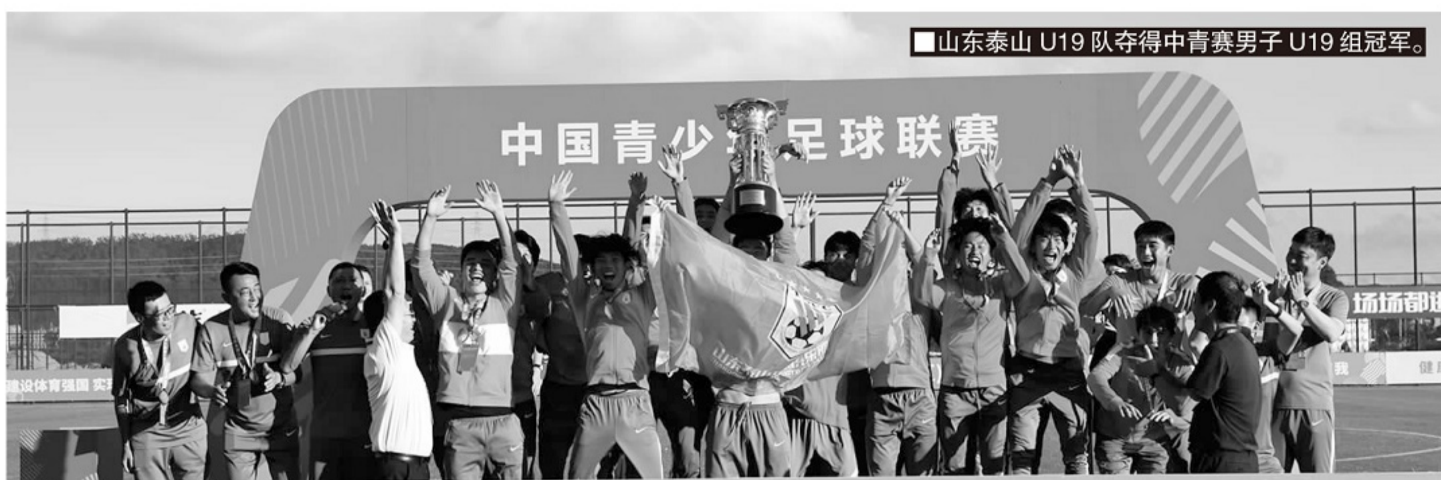
■山东泰山U19队夺得中青赛男子U19组冠军。

女子组奖盘造型取自中国传统的葵形镜,11瓣葵花象征11名青少年女子球员,寓意光辉和圆满,彰显了青少年足球的希望与荣光。奖杯和奖盘可流动使用,奖杯底座后侧和奖盘盘面可以镌刻每届