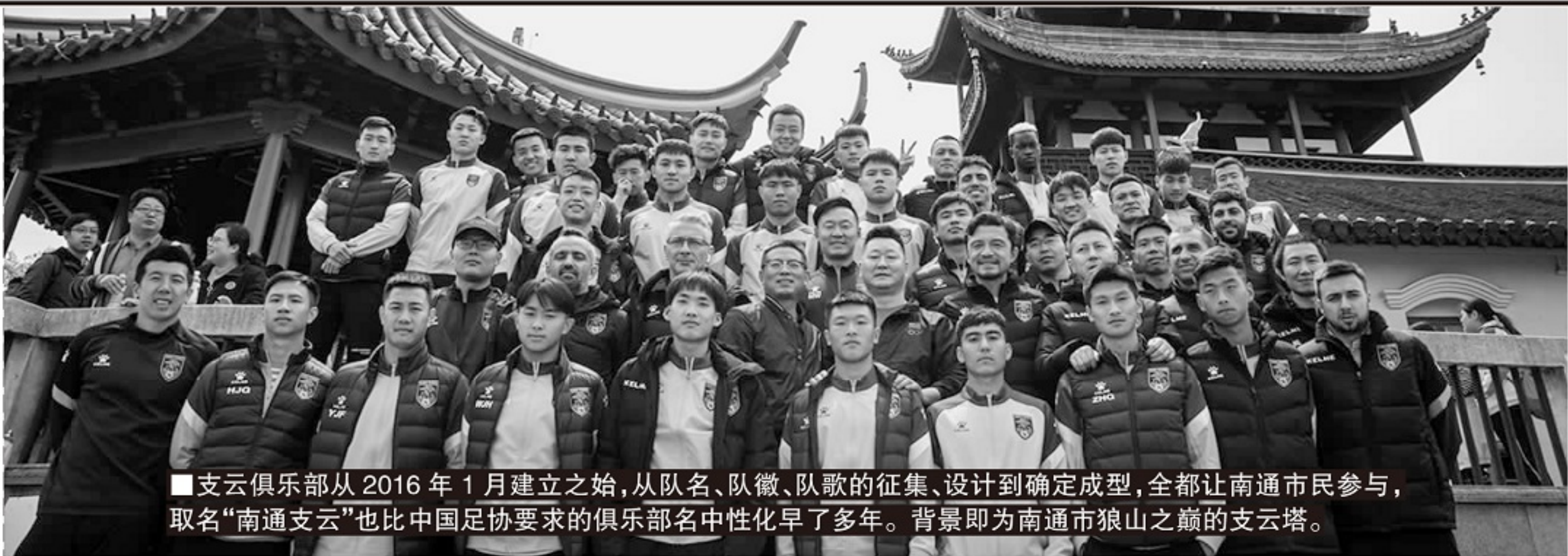
支云俱乐部从2016年1月建立之始，从队名、队徽、队歌的征集、设计到确定成型，全都让南通市民参与，取名“南通支云”也比中国足协要求的俱乐部名中性化早了多年。背景即为南通市狼山之巅的支云塔。