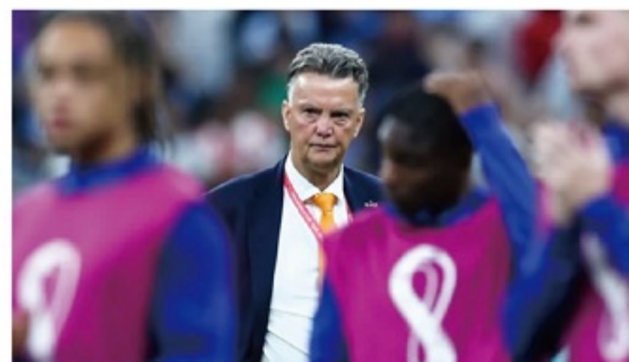
被阿根廷淘汰后，范加尔正式确认离任，科曼将重掌橙色军团帅印。

71岁的范加尔阅尽千山，如今再也不会只以战术模板去套球员。尽管他的足球仍然有着浓烈的结构化和套路化，但他也明白，体系和球员之间，后者更重要。所以梅西在罚进点球后，用里克尔梅当年标志性庆祝动作“回敬”范加尔，多少还是有点太印象派了。想必，若是如今的老范手里有个里克尔梅，他必定会将之奉若珍宝。在他“废弃”里克尔梅的岁月里，老范又何时曾料想，20年后，他会打一场如此“穷”的仗？