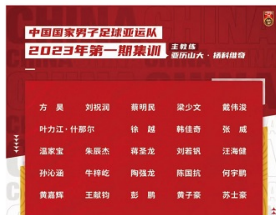
■国家男子足球亚运队定于 2023 年 2 月 4 日至 2 月 14 日赴佛山市组织集训。