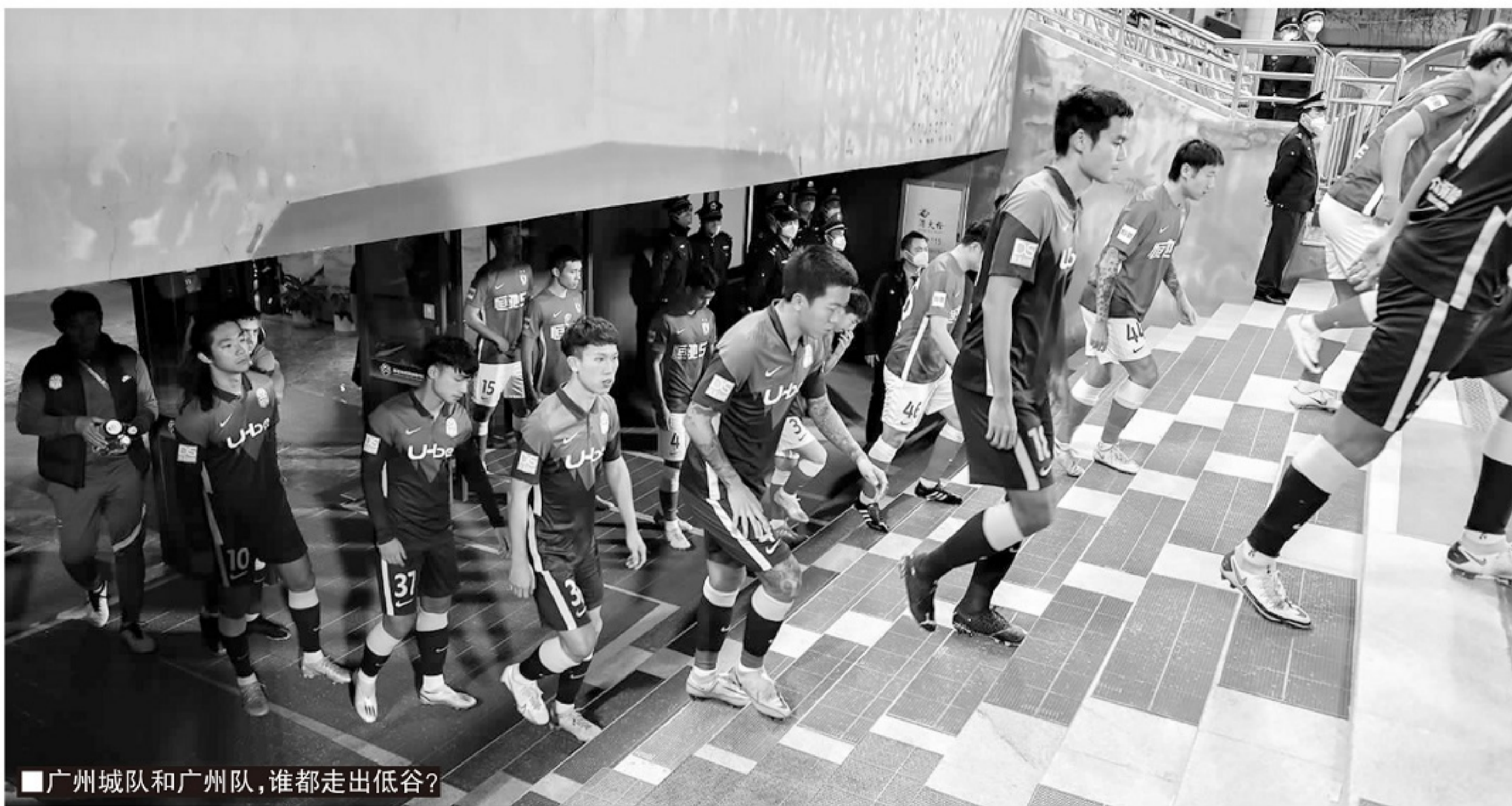
■广州城队和广州队,谁都走出低谷?

去年底,广州城队在主教练李玮锋的带领下,在赛季初13连败的情况下神奇逆转保级成功,这支顽强的球队,得到了广州球迷的高度认可,球队完成保级后,广州城俱乐部的管理层,开始积极为球队接下来的生存想办法。