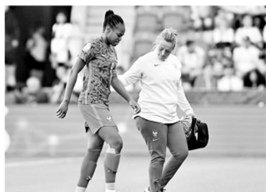
去年欧洲杯法国前锋卡托托在小组赛就受伤,早早退出金靴竞争。

男足球员最常见的严重伤病是大腿肌肉拉伤,几乎占有所有伤势的15%,而且严重影响球员赛季的完整性。女足球员最恐惧的伤势是膝盖前交叉十字韧带,有研究表明,女足球员遭遇膝盖韧带伤势的概率高达男足球员的6倍。虽然英足总为此以最近4个赛季女足联赛的受伤部位进行了研究,显示前交叉十字韧带仅占有所有损伤的1.3%。但本赛季英格兰女足联赛,已有10名顶级球员遭遇了前交叉十字韧带重伤,证明这种重伤在顶级女足球员中发生的概率更高。除了阿森纳女足两位球星,西汉姆联的杰西卡·齐乌、阿斯顿维拉的