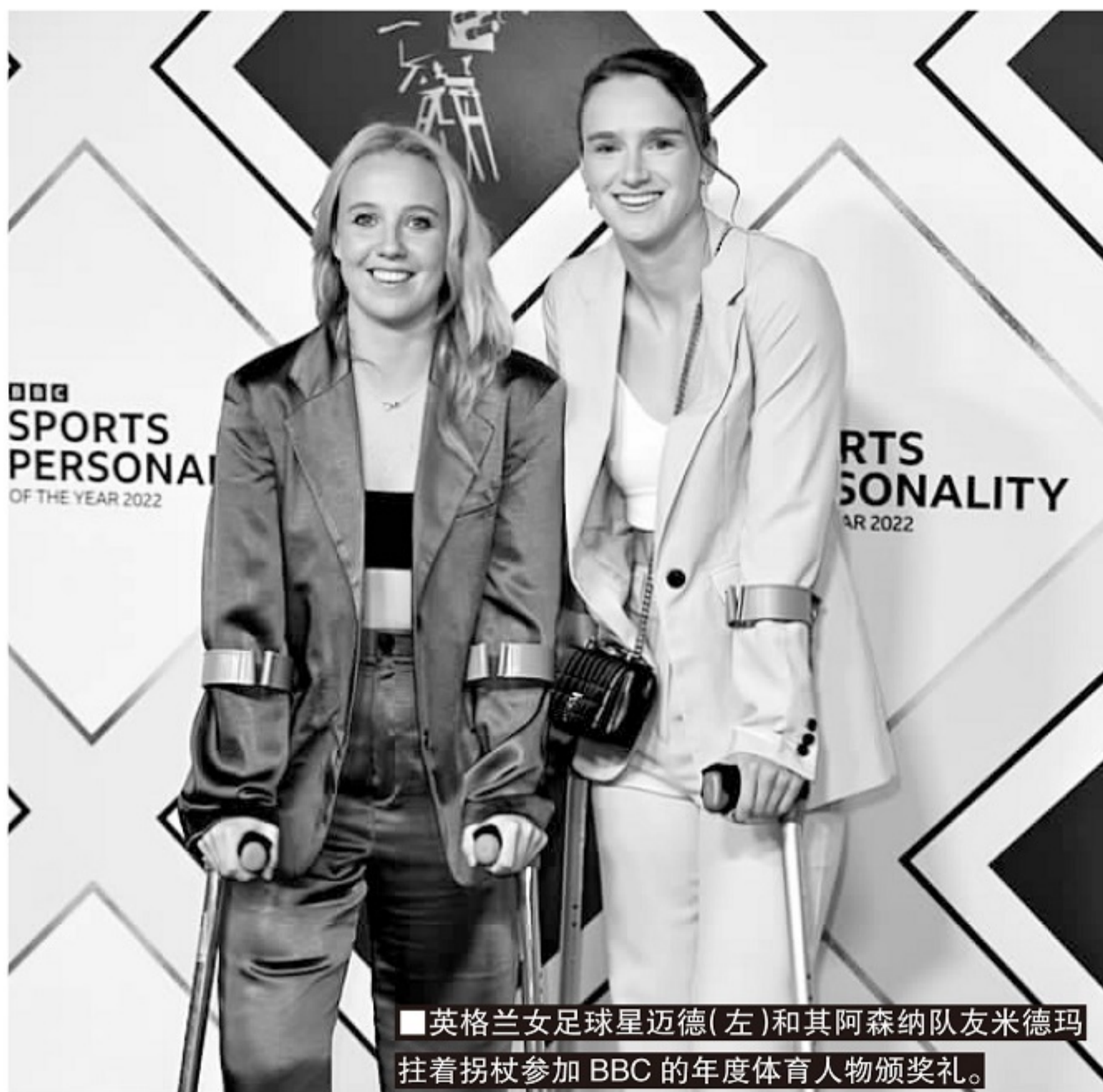
英格兰女足球星迈德(左)和其阿森纳队友米德玛拄着拐杖参加BBC的年度体育人物颁奖礼。