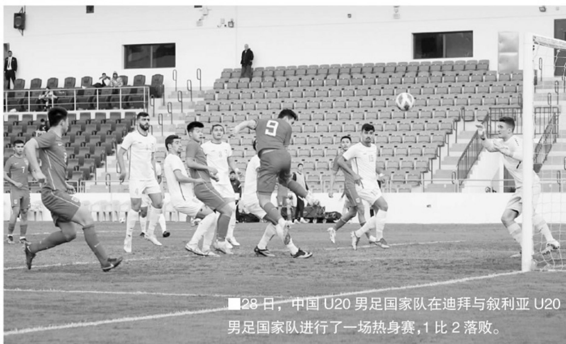
28日，中国U20男足国家队在迪拜与叙利亚U20男足国家队进行了一场热身赛，1比2落败。

目前，U20国家队的备战计划都在严丝合缝地推动中，2月2日，U20国家队将从迪拜飞赴克罗地亚萨格勒布，同克罗地亚