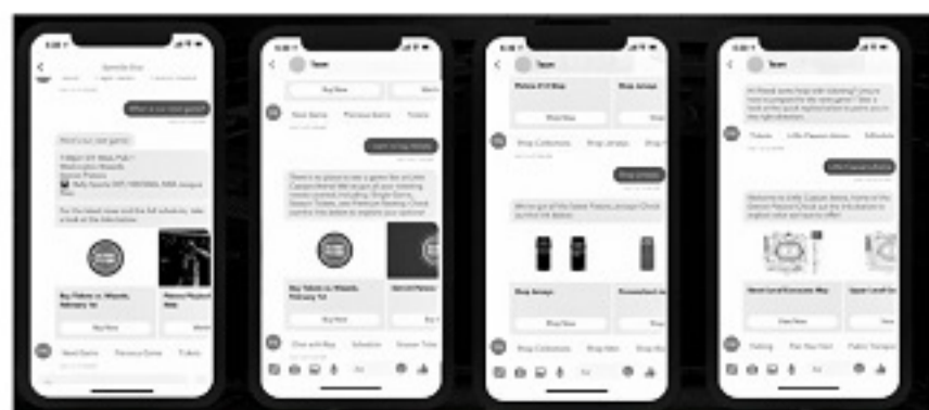
■ NBA 的底特律活塞已经开始利用 GameOn 进行球队的各种商业活动。