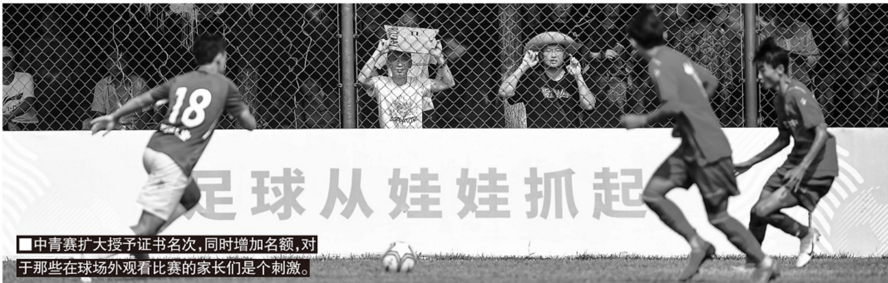
■中青赛扩大授予证书名次,同时增加名额,对于那些在球场外观看比赛的家长们是个刺激。

目前要少。此次中青赛全面扩大授予名次,同时增加名额,毫无疑问会进一步提升中青赛的吸引力,也会进一步吸引更多校园足球的孩子参与。