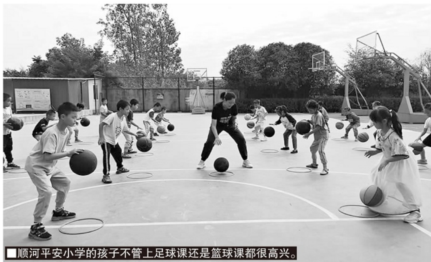
■顺河平安小学的孩子不管上足球课还是篮球课都很高兴。

“跟我们学校比，镇上大一点学校可能都处于下风。”顺河平安小学的硬件条件良好，源自中国平安集团的“希望工程”救助小组。顺河平安小学的前身是顺河镇董滩小学。1991年，董滩小学被洪水冲毁。此后两年，村里的孩子们只能去附近村的学校借读。为了改变这种状况，中国平安集团派队前往顺河镇实地考察，并在董滩小学的原址上建成了一座全新的教学楼。1994年，顺河镇平安希望小学正式建成。新的校区占地一万平方米，是镇上最早拥有电脑机房、图书阅览室和大屏幕投影教室的学校。目前学校正在翻新的足球场工程，也离不开中国平安集团的支持和帮助。