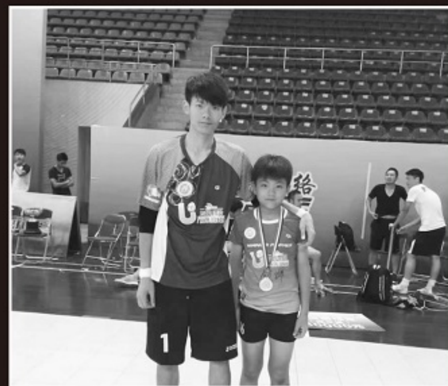
李昊的成长