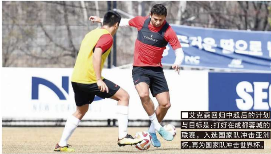
艾克森回归中超后的计划与目标是:打好在成都蓉城的联赛,入选国家队冲击亚洲杯,再为国家队冲击世界杯。

我去年没有办法在现场看球队的每一场比赛,而且因为版权的原因,我只能通过一些视频或者资讯软件来关注中国足球的相关信息。成都队在去年一整年的经历是非常让人惊喜的,我很开心在中国有这么一支很有韧劲的成都队,当时我就非常地看好这支球队,所以我去年一年也在关注着这支球队各方面的进展。后来成都队有意引进我,我们之间有过很多次接洽,我进