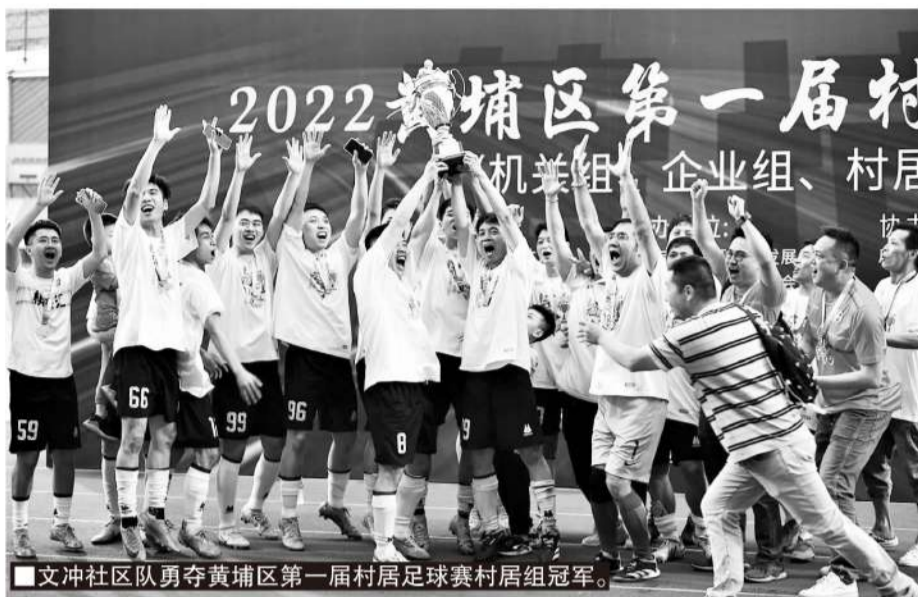
■文冲社区队勇夺黄埔区第一届村居足球赛村居组冠军。