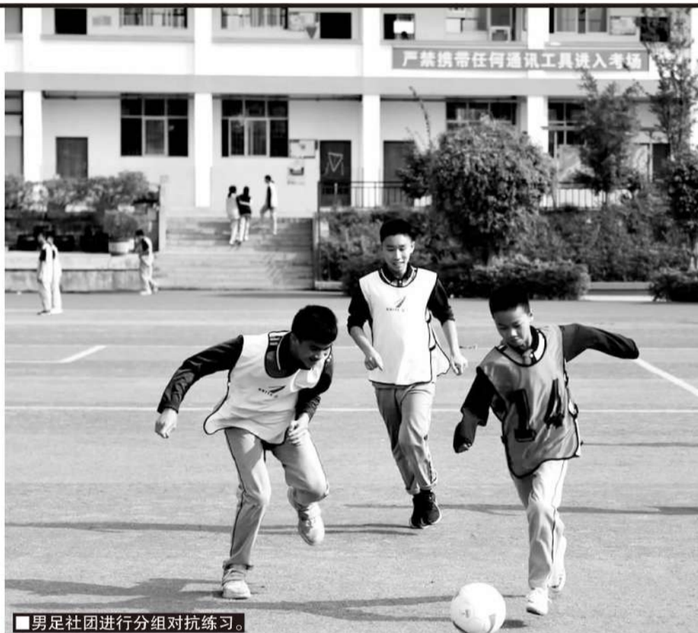
男足社团进行分组对抗练习。

相比建队后可圈可点的战绩——女足曾获得市级校园联赛高中组冠军、男足获得三等奖——更让人称道的是文山二中的足球普及率。班级联赛采用4节轮