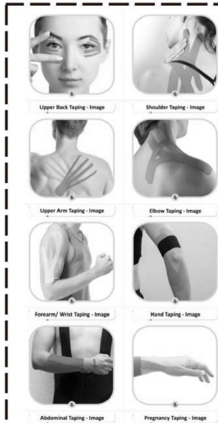
正确粘贴肌效贴,才能起到良好的效果。

运动肌效贴用于面部,不仅能在运动中减轻面部疼痛感,提高呼吸效率,还可以消除浮肿,纠正头部相对于脊柱的定位。至于抚平嘴部、眼睛、前额和颈部周围的皱纹,减少下巴和更好塑造面部自然形状,则是肌效贴更受女性运动爱好者欢迎的功效。