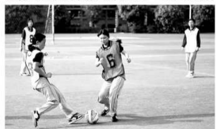
女足社团活动是课后服务的内容之一。

搏,以及协作中强化的团队意识。她特别看重的是,孩子们可以通过足球比赛学会对规则的理解和尊重,“发自内心的理解,心甘情愿地遵守,而不是勉强或盲从,这对现阶段孩子的成长,还有他们的终身健康发展都很关键。”有不少家长,包括部分教练认为,足球能让调皮、暴躁的孩子释放过剩的精力,而从一名教育工作者的视角来看,足球恰恰是提升学生素质、培养良好公民的途径之一。