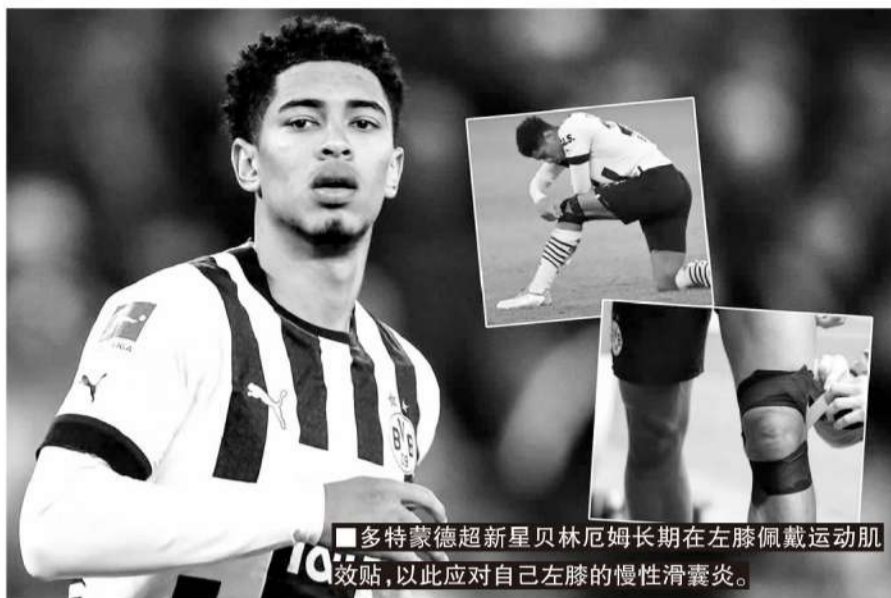
多特蒙德超新星贝林厄姆长期在左膝佩戴运动肌效贴,以此应对自己左膝的慢性滑囊炎。

2016年的研究表明,针对滑囊炎的治疗,运动肌效贴与萘普生(抗炎药)+物理按摩相比,对于减轻疼痛和消除肿胀效果更明显。此外,运动肌效贴对精英运动员下肢力量的好处也非常明显,研究数据表明使用了运动肌效贴的女性球员垂直跳跃高度普遍提升了2-3厘米。使用运动肌效贴可以增强球员在比赛期间下肢的力量输出和保持耐力。同时在一