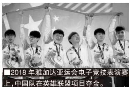
■2018 年雅加达亚运会电子竞技表演赛上,中国队在英雄联盟项目夺金。

虽然 LCK 方面尚无官方或核心爆料人放话,但随着 LPL 方面的出牌,LCK 势必也要进行跟牌。至少在队员层面上,亚运会金牌意味着将免除兵役,如此背景下,有 LPL 韩籍外援开始“回流”,争夺成为国家队选手征战亚运的机会。