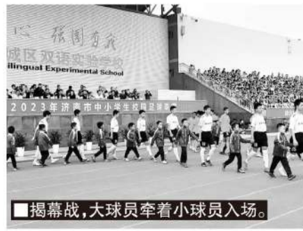
■揭幕战,大球员牵着小球员入场。

这场历城双语和泉城中学的比赛,还吸引了不少家长前来观看,他们也非常感慨:“这么多人一起看球,这种激动人心的场面,这么激烈的比赛,对于孩子们的锻炼价值,尤其是心理层面的锻炼价值实在是太大了,他们的内心一定会因此更加强大。”