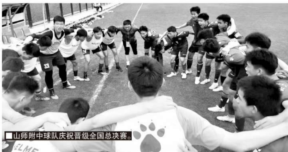
■山师附中球队庆祝晋级全国总决赛。

可最终山师附中赢了南通支云。“过程有些曲折,我们山师附中常年打国内的比赛,对阵的强队很多,所以球队一直