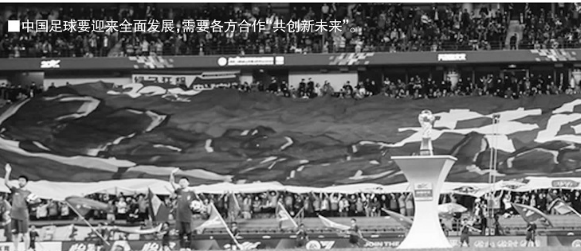
■中国足球要迎来全面发展,需要各方合作“共创新未来”。