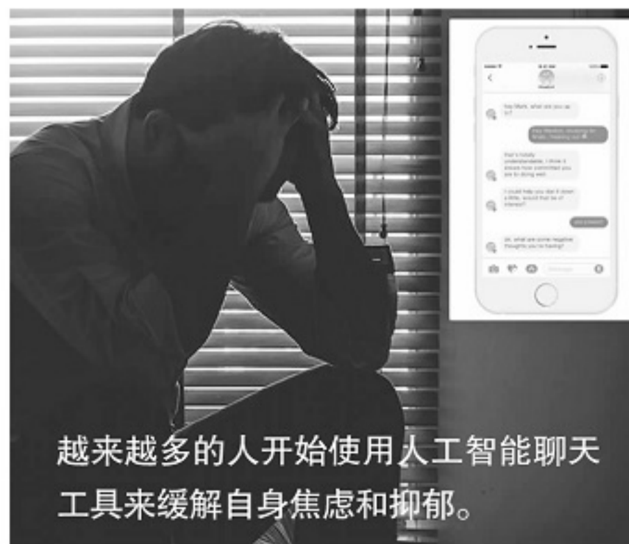
越来越多的人开始使用人工智能聊天工具来缓解自身焦虑和抑郁。

人工智能目前还不能完全替代专业和有深度的心理治疗,但作为面对面心理治疗的补充,人工智能心理健康工具能够提供广泛的帮助。