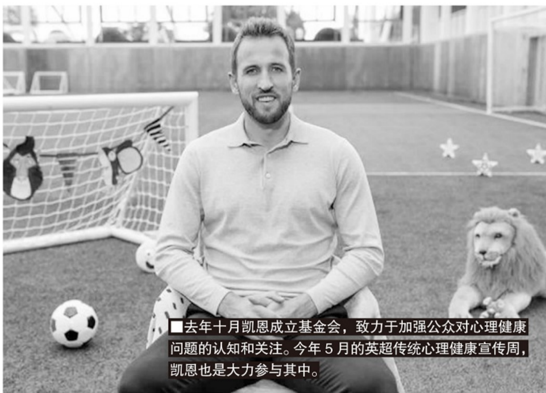
■去年十月凯恩成立基金会,致力于加强公众对心理健康问题的认知和关注。今年5月的英超传统心理健康宣传周,凯恩也是大力参与其中。

整个足球世界首先要改变的是传统偏见,即认为男儿有泪不轻弹,男性不能公开哭泣,表达负面情绪,公开自己