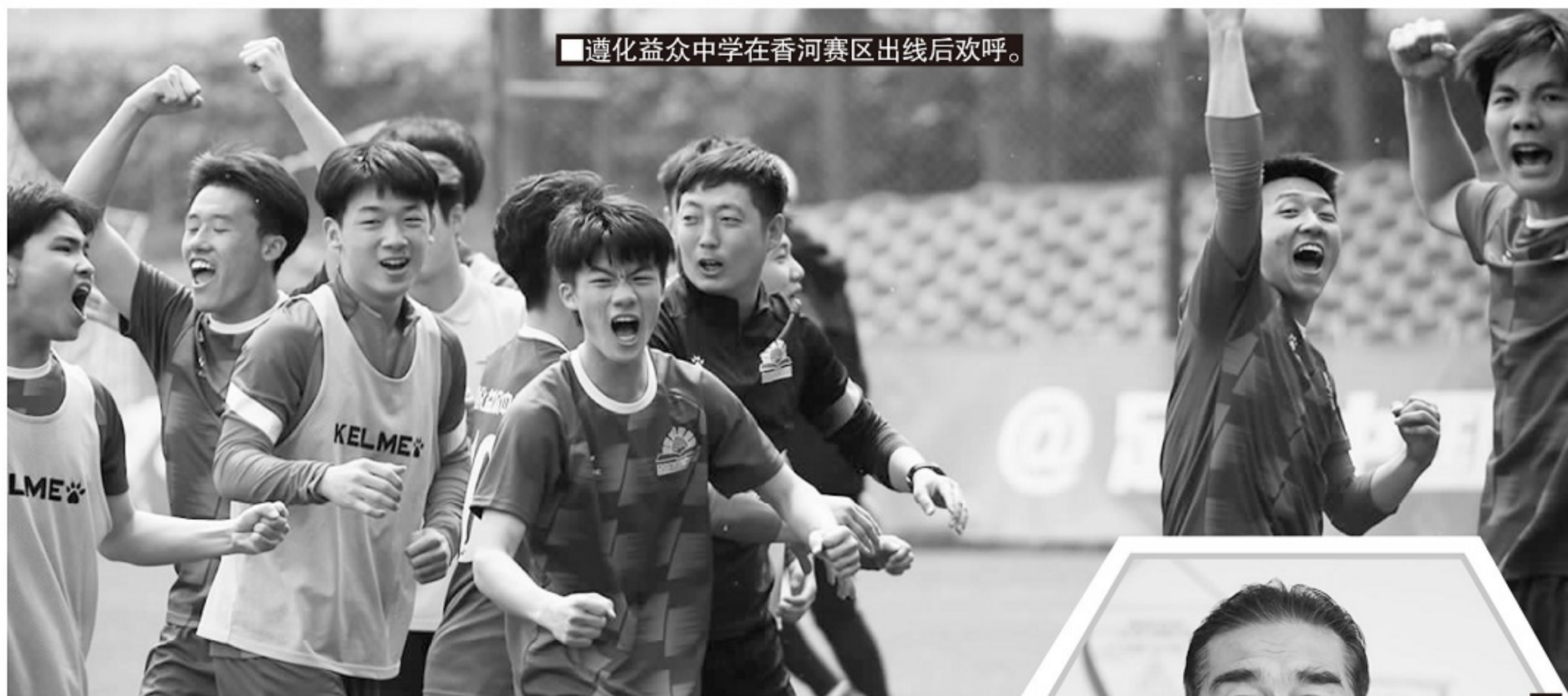
■遵化益众中学在香河赛区出线后欢呼。

60岁的马鸿鸣说,教育是十年树木、百年树人的事业,体育不也例外。“足球不能求快。我们看的是二十年、三十年以