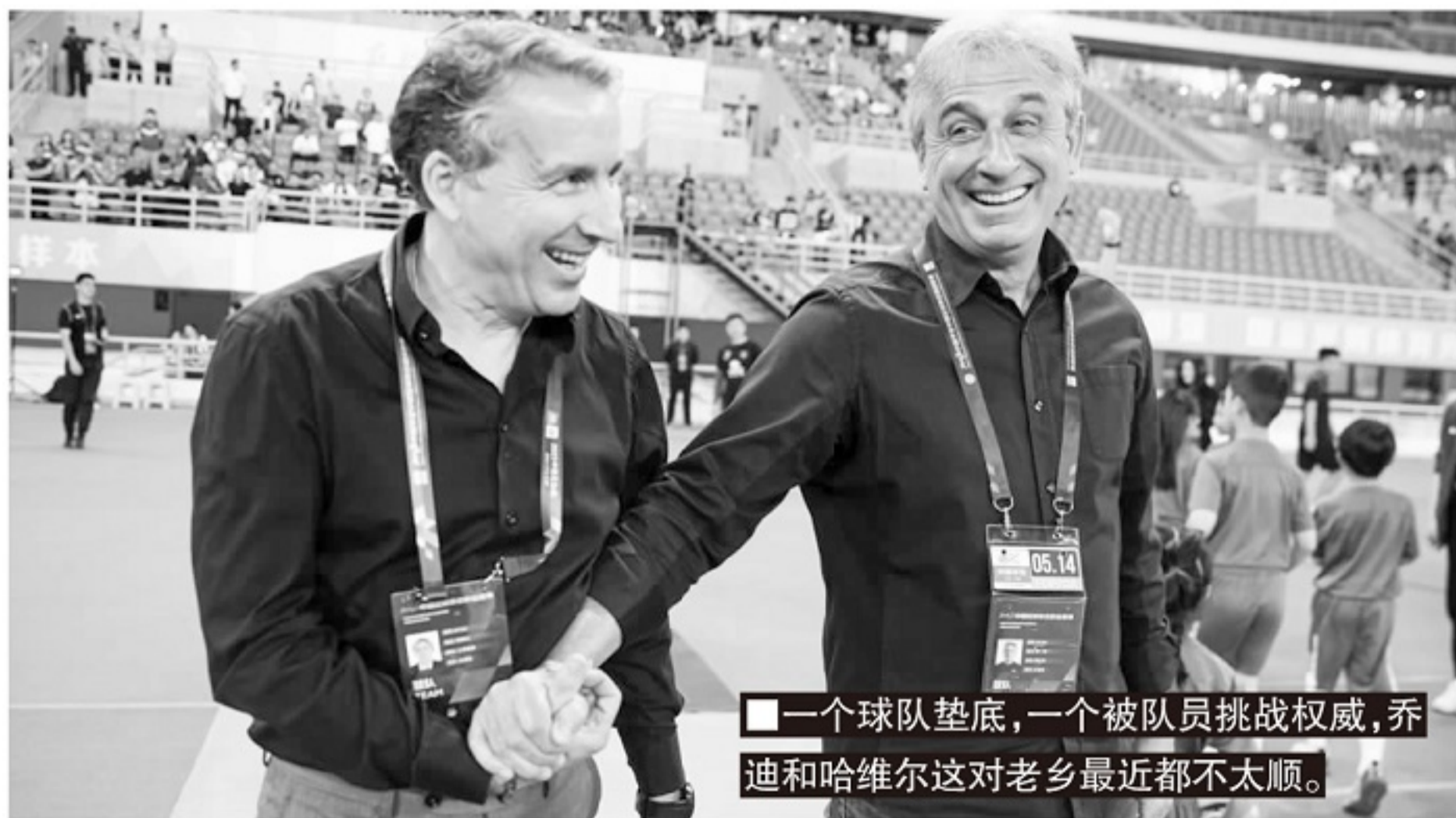
■一个球队垫底,一个被队员挑战权威,乔迪和哈维尔这对老乡最近都不太顺。