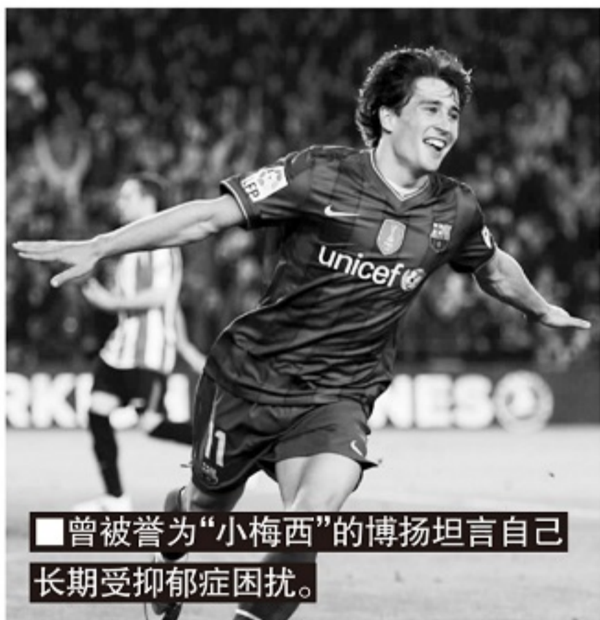
■曾被誉为“小梅西”的博扬坦言自己长期受抑郁症困扰。

英超联盟早在2020年新冠疫情爆发时,就开始了每年一度的心理健康周活动。当时有调查显示,因为新冠疫情,英国的焦虑和抑郁症患者短时间内激增了25%。近年有关球员罹患焦虑、抑郁等心理疾病,严重影响竞技状态甚至选择自杀的新闻不断。不久前退役的前巴萨天才球