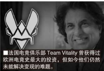
法国电竞俱乐部 Team Vitality 曾获得过欧洲电竞史最大的投资,但如今他们仍然未能解决变现的难题。

根据国外第三方数据平台的统计,MSI 上 JDG 对阵 T1 的观众峰值突破了 200 万的大关,超越去年 RNG 对阵 T1 的 BO5 成为 MSI 历史上收视峰值人数最高的一场比赛。