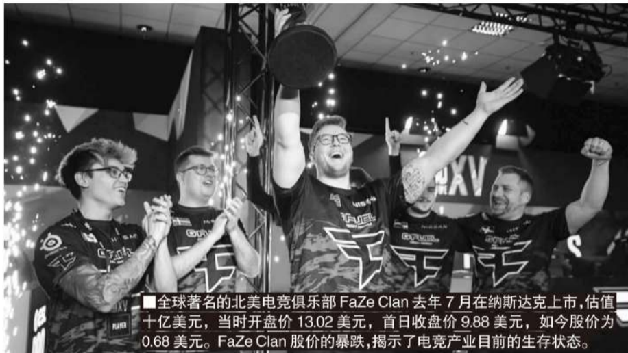
全球著名的北美电竞俱乐部 FaZe Clan 去年 7 月在纳斯达克上市,估值十亿美元,当时开盘价 13.02 美元,首日收盘价 9.88 美元,如今股价为 0.68 美元。FaZe Clan 股价的暴跌,揭示了电竞产业目前的生存状态。

对于资本而言,他们可以直接将 NBA 的模型套入到电竞当中,只是把篮球换成了电竞而已。在理解这项新兴体育的未来盈利模型中,也就直接套用了传统体育的模型,即通过提供高质量的比赛