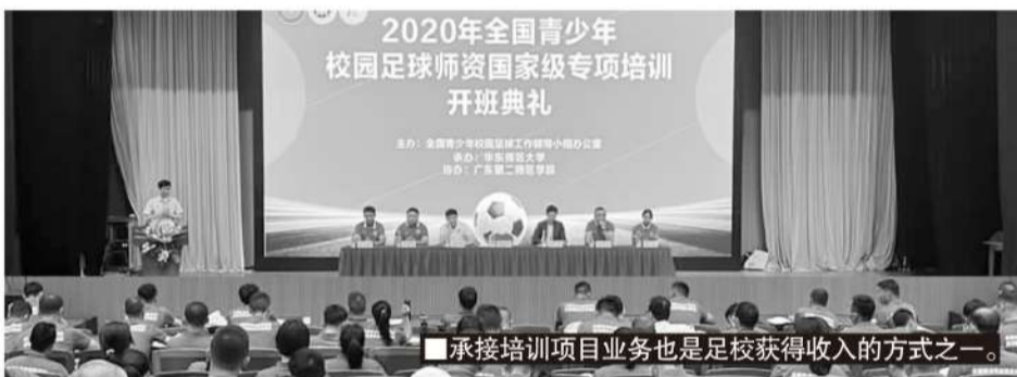
承接培训项目业务也是足校获得收入的方式之一。

“学校充分利用自身软硬件,按照市场经济规律实现内部创业、自主运营创收,比如我们把一些闲置的校区外租,比如我们积极主办、承办各种类型的赛事、培训、夏令营、研学以及进行一系列的商务合作等等。保证学校收入能够稳定且持续,是学校