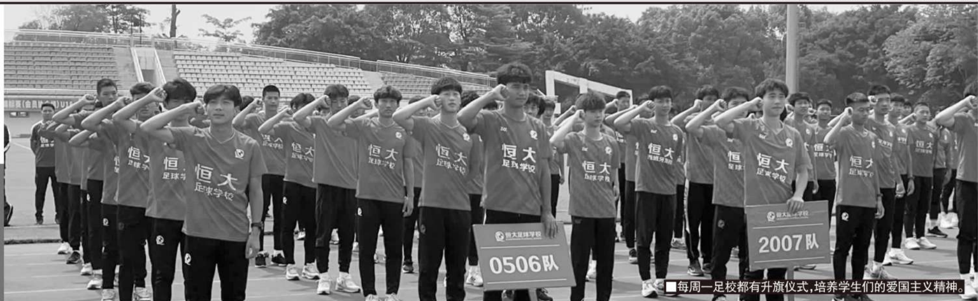
■每周一足校都有升旗仪式,培养学生的爱国主义精神。