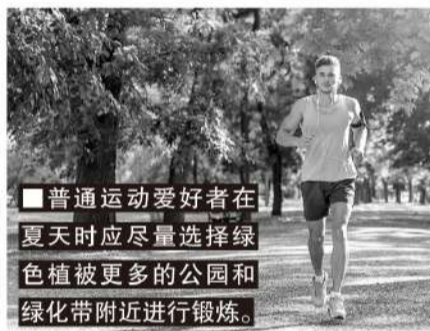
普通运动爱好者在夏天时应尽量选择绿色植被更多的公园和绿化带附近进行锻炼。

主动适应高温天气下的训练和比赛,不仅要从日常的高温适应性训练开始,还要主动调整习惯的训练强度,增加训练后的恢复时间和水分与营养的补充,以及保障睡眠时间的充足。很多职业运动员都不可避免在阳光直射的体育场比赛,但运动爱好者可以选择更有利于身体健康的户外环境,比如选择绿色植被更多的公园和绿化带附近。晨跑爱好者最迟凌晨5点就要开始,户外锻炼时间控制在1小时左