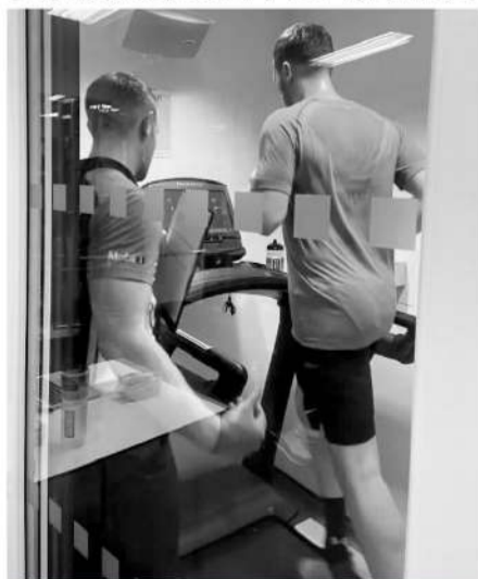
为了让自己在酷热环境下比赛时有更好的表现,越来越多的许多运动员选择在高温训练室“特训”。