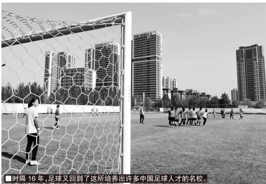
■时隔16年,足球又回到了这所培养出许多中国足球人才的名校。

2021年3月,经大连市统一协调,大连足球运动学校终于“鸟枪换炮”:学校整体搬迁到大连体育中心,接收了3块标准足球场(2块天然草皮足球场和1块人工