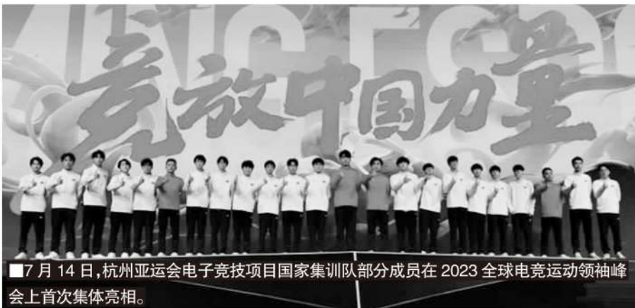
■7月14日，杭州亚运会电子竞技项目国家集训队部分成员在2023全球电竞运动领袖峰会上首次集体亮相。

电竞体育化的步伐并不现实，腾讯若想实现体育化的夙愿，或许借助第三方的力量更具可行性。