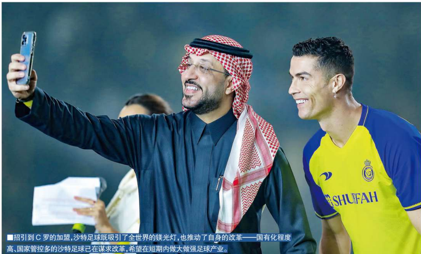
■招引到C罗的加盟,沙特足球既吸引了全世界的镁光灯,也推动了自身的改革——国有化程度高、国家管控多的沙特足球已在谋求改革,希望在短期内做大做强足球产业。

所以,当有些评论在批评中国足球的时候,把一切问题的症结都推到制度上,继而质疑中国足球的制度时,是不是该看看沙特足球的制度模式?不管什么制度、什么模式,是不是总有人能够闯进世界杯,总有人能在世界杯上创造一些奇迹?因此,当有