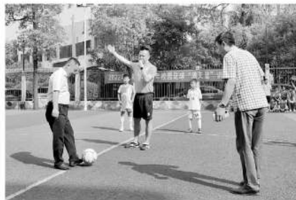
■珠晖区教育局领导为满天星训练营“开球”。

区教育局分管领导说,早在2015年教育部主导校园足球之前两年,珠晖区就已经在校园足球领域布局发力,而2016年入选全国青少年校园足球试点县(区)带来的国家级资金补助和省、市、区三级的配套,给了珠晖人的足球梦一个强有力的支撑。“衡阳冶金总厂从上世纪五十年代起开创的足球传统,经过一代代人的坚守和传承,这一代迎来了发扬光大的最好机遇。”