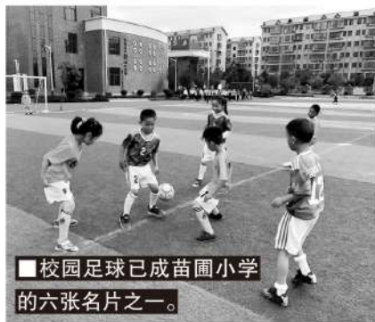
校园足球已成苗圃小学的六张名片之一。