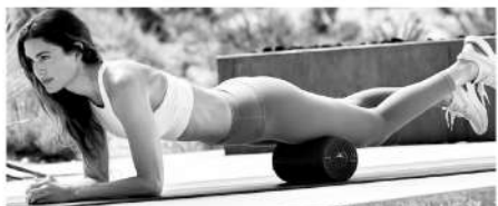
■泡沫轴对女性很友好。

总而言之,选择合适的物理恢复设备(器械),以及合适的营养剂,对于女性的运动恢复和伤后康复非常重要。