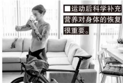
■运动后科学补充营养对身体的恢复很重要。

运动恢复分为被动和主动,被动恢复包括充足的睡眠,足以弥补热量消耗和保持能量平衡的营养补充,主要是碳水化合物、蛋白质和液体,同时控制摄入营养的时间。主动恢复在于考虑是否有必要进行外部干预,确保足够的恢复时间。如果没有足够的恢复时间,就要考虑实施帮助恢复的物理手段,包括冷疗,热疗,按摩,伸展,肢体分级压力等。