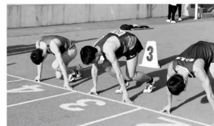
百年来，径赛一直是岳云中学的传统。

信件中这样描述了当时岳云中学的晨跑活动：“住校学生每天早上要拿着自己的铭牌，晨跑800米到当时的市体育场协操坪，跑完后将自己的名牌放进杨一南等体育老师所持的铭牌箱中再回校念书。一南师等体育老师每天按箱内学生名字进行统计，缺席三次计一小过，三次小过记一大过，三次大过就要被开除学籍。”这也意味着，若无他过，学生缺跑27次就会被岳云中学除名，足见岳云中学对体育的重视程度。