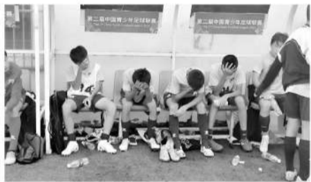
中青赛的第二个核心问题：资金缺口呈现扩大趋势。

嘉定汇龙的青训已经做了 10 年了，他们的努力和进步，我们必须要看眼里，这样热爱足球、为中国足球默默做着贡献的俱乐部，如果不能被重视，不能被尊重，不能被支持，中国足球的希望又在哪里呢？