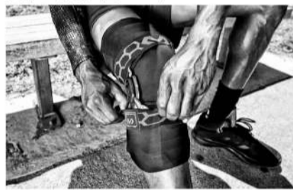
■大家可以选择佩戴护具来减少ACL伤病的发生。

劳程度或已经出现的受损，从而在遭遇重伤之前得到有效的休整。美国的内斯勒医生推出的ACL损伤预防计划，就是建立在可穿戴传感器与分析软件的基础上，确定受伤风险，这可以让ACL的非接触性伤害降低58%。