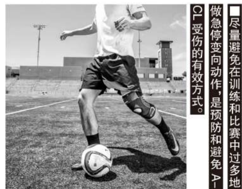
■尽量避免在训练和比赛中过多地做急停变向动作，是预防和避免ACL受伤的有效方式。

因此，为了更持续地运动和降低医疗成本，每个运动爱好者都要尽可能让自己的膝盖前十字韧带更放松，而不是为了跳得更高，跑得更快，让ACL更紧张。