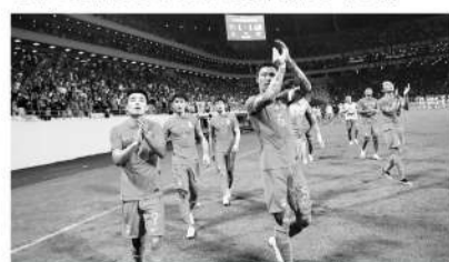
武磊在对阵马来西亚比赛中的表现令人失望。

谢鹏飞带给扬科维奇很重要的思考是,在国足不具备全能型后腰(吴曦如果攻防两端奔波会带来体能的快速下降)的情况下,设置前腰或许是改变的方向,如果变成常规配置的话,那么国足在这个位置上除了谢鹏飞之外,恐怕也需要考察和选择新的球员。