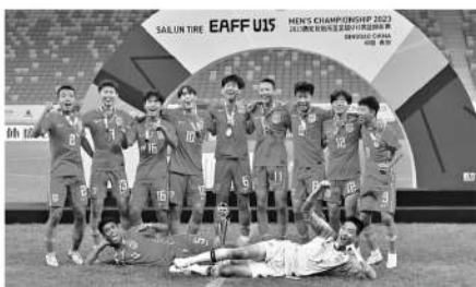
这次 U15 国家队中的恒大足校球员。