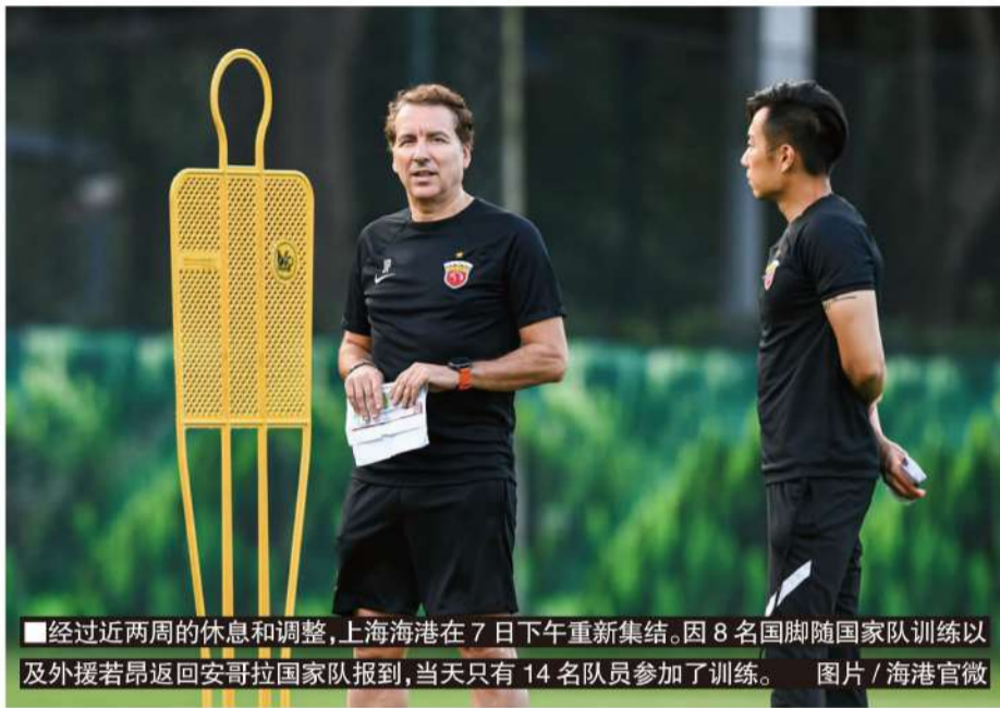
■经过近两周的休息和调整，上海海港在7日下午重新集结。因8名国脚随国家队训练以及外援若昂昂返回安哥拉国家队报到，当天只有14名队员参加了训练。

9月7日，经过了一段时间的休息，海港队在上海世纪公园基地重新集结，哈维尔也和球员站到了训练场上。实际上，在球队集合前，哈维尔和海港高层进行了交