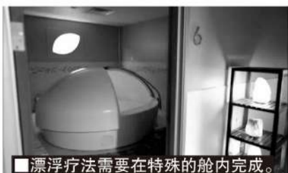
■漂浮疗法需要在特殊的舱内完成。