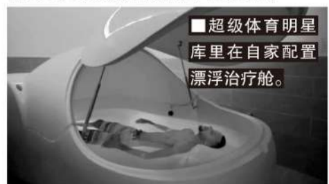
■超级体育明星库里在自家配置漂浮治疗舱。

NBA巨星库里、美式橄榄球巨星布雷迪、游泳巨星菲尔普斯、英超名宿鲁尼、德国男足国家队、美国奥运队选手、高尔夫、网球、体操、极限运动、冬季项目选手都是漂浮疗法的主要受益者。库里、布雷迪、菲尔普斯和鲁尼家里都有漂浮治疗舱,每周要耗费10多个小时进行漂浮治疗。对于普通运动爱好者而言,每周1次漂浮治疗的频率更适合。