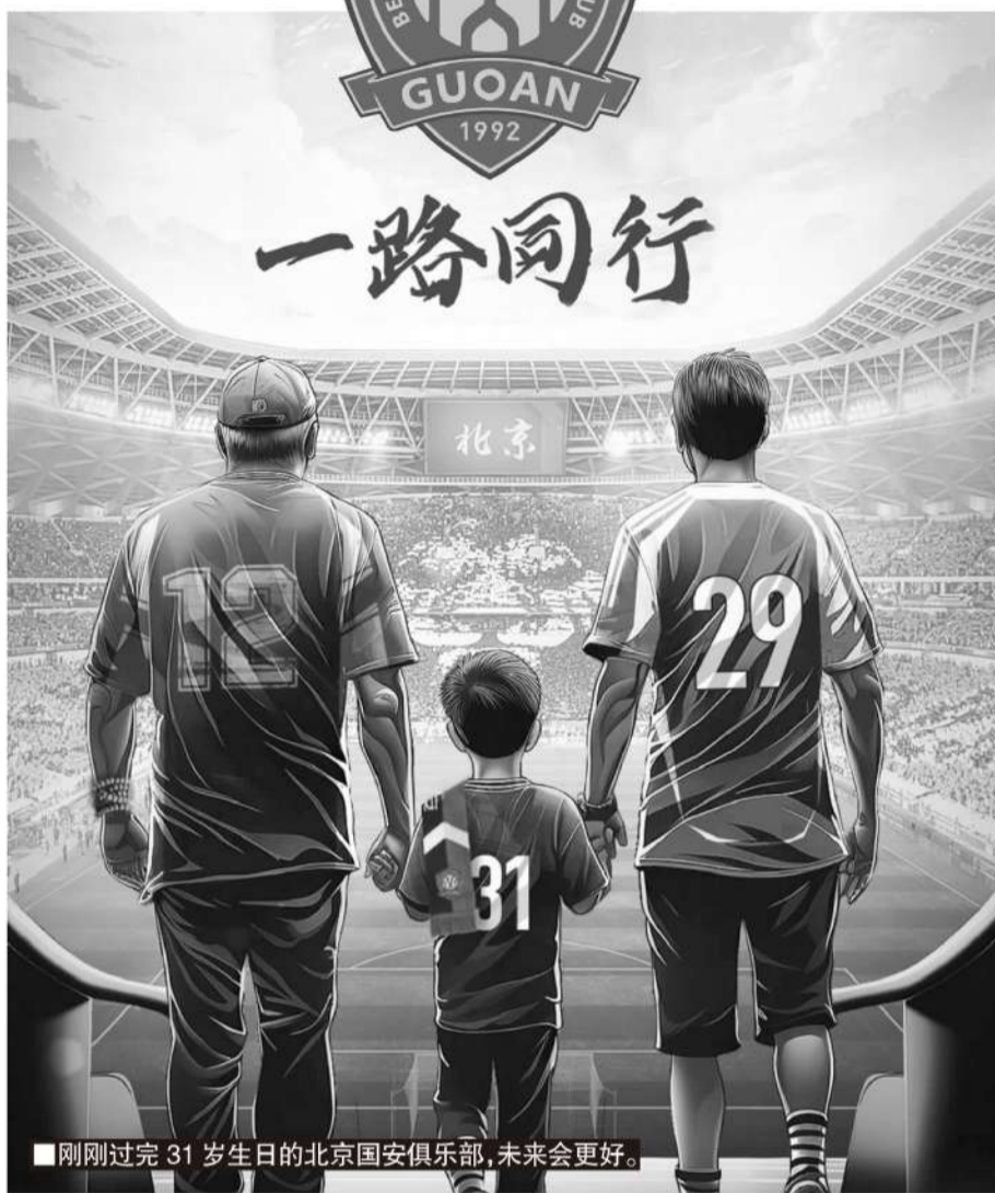
刚刚过完31岁生日的北京国安俱乐部,未来会更好。

斯希望引进他所了解的球员,法比奥就是个例子,他曾经在苏亚雷斯手下效力,教练很了解他的特点,在加盟国安后,他也融入非常快。所以,苏亚雷斯首选老熟人,他希望是在葡萄牙联赛效力或者是由葡萄牙青训体系培养出的球员,最起码也要是葡语系的。