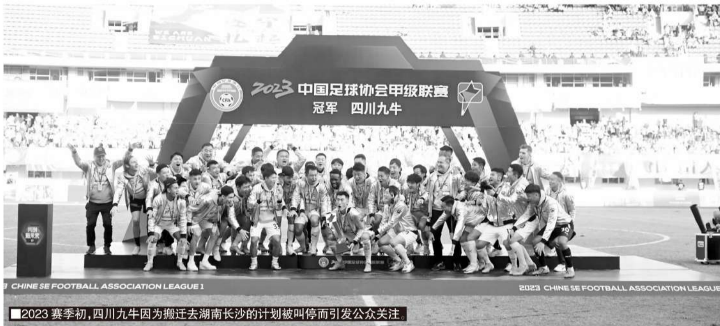
2023赛季初,四川九牛因为搬迁去湖南长沙的计划被叫停而引发公众关注。

相较之下,一些频繁变换主场的“流浪球队”在建立城市认同感方面面临一些困境。这或许不仅仅是足球层面的问题,也可