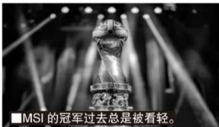
■MSI的冠军过去总是被看轻。

这一次的赛事改革重点,拳头直接将MSI与全球总决赛进行“捆绑”,从而提升MSI的重要性和竞争力。在S14全球总决赛上,LEC、LCS、LCK和LPL各有三个基本的全球总决赛名额,PCS和VCS各有两个全球总决赛名额,LLA和CBLOL各有一个全球总决赛名额。