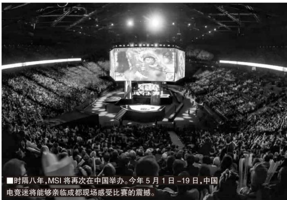
■时隔八年,MSI将再次在中国举办。今年5月1日-19日,中国电竞迷将能够亲临成都现场感受比赛的震撼。

如果说全球总决赛是期末结业考试的话,那么MSI更像是一场期中模拟考试——MSI虽然非常重要,但也容易被遗忘,毕竟大多数人都只会记得期末结业