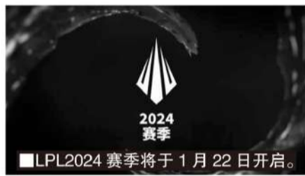
■LPL2024赛季将于1月22日开启。

在电竞俱乐部还尚未完全探索出可持续的盈利方式之前,来自投融资市场的资金异常重要。