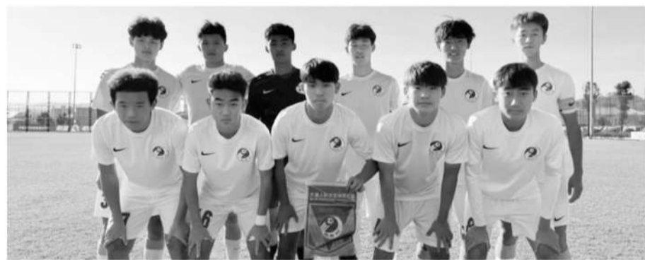
■从年初战斗到年末,大连人U17先后获得了2023中国足协青少年足球锦标赛(会员协会U16组)季军、第二届中国青少年足球联赛(男子高中年龄段U17组)全国第五名、2023中国足协青少年足球锦标赛(职业俱乐部U17组)全国第四名。

这几天,一些大连人梯队球员的家长通过各种方式联系记者,他们都很焦虑。“如果俱乐部没有了,这就意味着,孩子们可能又要面临重新选择,想要踢球又得离