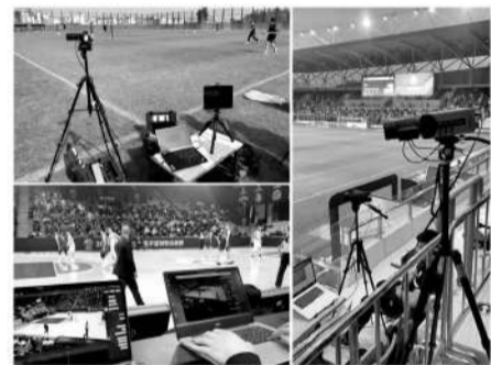
灵羲的产品已服务于足球和篮球领域。

这个对于数据近乎偏执的科技狂人,如今瞅准时机,正在完成一次持球突破、单刀赴会,他会计算好最精准的角度和速度,完成射门得分。