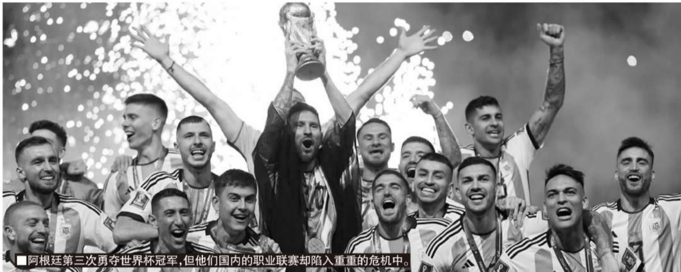
■ 阿根廷第三次勇夺世界杯冠军,但他们国内的职业联赛却陷入重重的危机中。

记者寒冰报道 生存,还是死亡?这是一个哈姆雷特的问题,也是阿根廷职业足球的终极问题。虽然1年多前夺得世界杯,让深陷经济危机的阿根廷球迷暂时忘记了贫困、失业和痛苦,但终究还是要回到现实中。去年底阿根廷人选择了经济学家米莱作为新总统,希望他可以化解愈演愈烈的经济危机。在米莱解决经济危机的千头万绪中,他对阿根廷足球的变革框架具有重要位置,也震动了整个阿根廷。