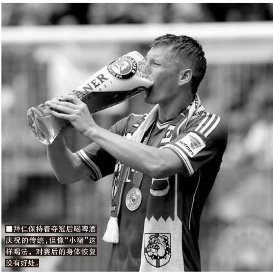
■拜仁保持着夺冠后喝啤酒庆祝的传统，但像“小猪”这样喝法，对赛后的身体恢复没有好处。

当然，这些研究的结论主要基于标准化饮用量，结论可能并不适用于运动爱好者们随意摄入啤酒的情况。绍恩菲尔德博士是莱曼学院副教授兼健康运动科学顾