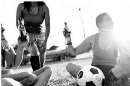
■酒精含量不高的啤酒可能是不错的运动后恢复辅助剂。

啤酒是运动人群在运动后社交、庆祝胜利最常见的饮料，尽管广受欢迎，但没有运动营养专业研究啤酒对运动表现、恢复和机体适应的影响。此前酒精饮料一向被视为顶尖运动员和运动爱好者的大忌，传统观点认为酒精饮料含有更高热量，会降低睾酮和生长激素水平，减慢肌肉恢复时间；另外，酒精还会影响神经系统，降低睡眠质量，导致身体机能恢复出现问题。