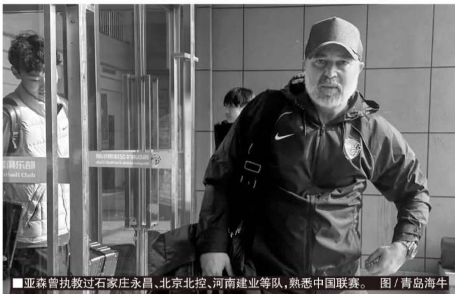
■亚森曾执教过石家庄永昌、北京北控、河南建业等队,熟悉中国联赛。

2024赛季,青岛海牛希望球队能够在成绩上有所突破,摆脱保级处境,进入中游集团。在新赛季,青岛海牛除了继续出战齐鲁德比,也将首次迎来中超的青岛德比。