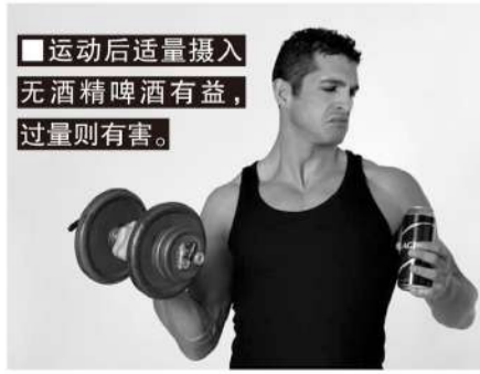
■运动后适量摄入无酒精啤酒有益，过量则有害。

韦恩博士强调绝对不要在运动前饮用任何酒精饮料，酒精对人体有害的脱水作用和对神经的影响，将让人无法正常锻炼身体，运动者自然无法获得想要的效果。但不含酒精的啤酒例外，2016年的研究表明，如果男性运动员在锻炼前45分钟饮用不含酒精的啤酒，那么他们在锻炼后的脱水程度会比喝啤酒后的脱水程度要低，与饮用水类似，但钠钾比例更高，有助于维持运动过程中的电解质稳态。