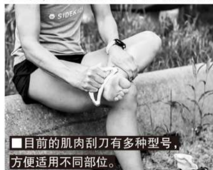
■目前的肌肉刮刀有多种型号，方便适用不同部位。

单手握式的肌肉刮刀(Eclipse)，握把与刮刀分开的设计与日食相似，在力量和精准性上又有提升。双手握住两端的更大型肌肉刮刀(Bow)，外形设计更像弓背，可用于更多部位肌肉软组织按摩。单手握式肌肉刮刀适合缓解斜方肌(背部)的压力，抓力更强的双手握式肌肉刮刀