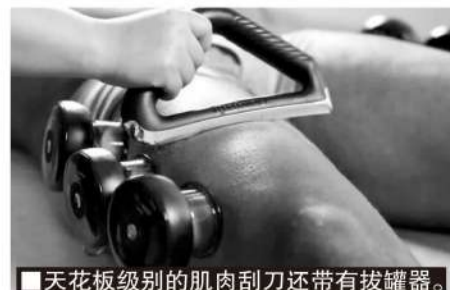
■天花板级别的肌肉刮刀还带有拔罐器。

总而言之，肌肉刮刀对运动员来说是最便捷的肌肉疲劳和损伤康复工具之一。大的运动损伤需要手术或专业医师，但之后的康复这把小小的肌肉刮刀就能发挥不小的作用。