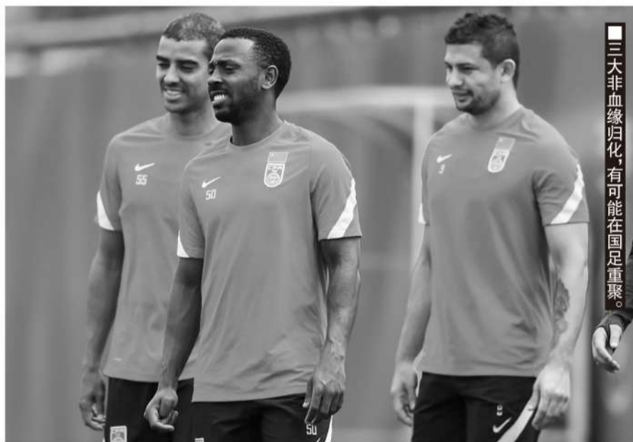
三大非血缘归化，有可能在国足重聚。

佩特科维奇7年的瑞士国家队之旅并不容易，因为合同是非常缜密并有严格考核的，最终坚持7年足以证明他在