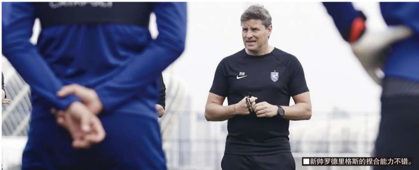
■新帅罗德里格斯的捏合能力不错。

上赛季后半段,武汉三镇酝酿股改,9月1日开始,原投资人停止向俱乐部注资。武汉体育局向俱乐部提供了一些资金,用于亚冠的支出,金额有限,俱乐部也经历了一段困难时间,也经历了一段时间