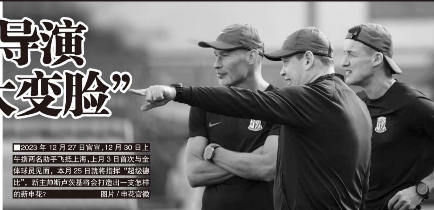
2023年12月27日官宣,12月30日上午携两名助手飞抵上海,上月3日首次与全体球员见面,本月25日就将指挥“超级德比”,新主帅斯卢茨基将会打造出一支怎样的新申花? 图片/申花官微

根据竞赛规则,本场“超级杯”采用单回合决胜制,如两队在90分钟内打平则需进行加时赛,若加时赛再平则以点球决胜。