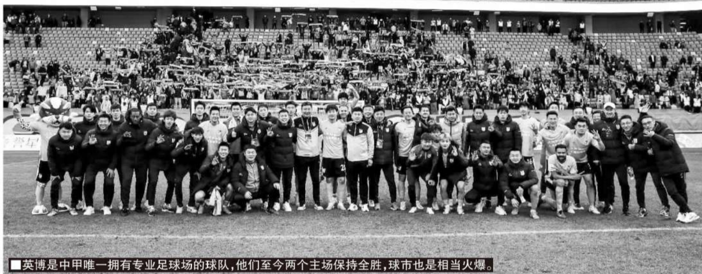
■英博是中甲唯一拥有专业足球场的球队，他们至今两个主场保持全胜，球市也是相当火爆。