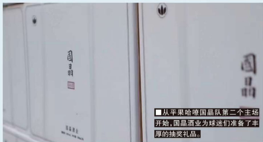
■从平果哈嘹国晶队第二个主场开始，国晶酒业为球迷们准备了丰厚的抽奖礼品。

如果说，苏东坡在词赋中代表古今文人骚客提出的将茶和酒这两种风雅之物合而为一的愿望，算得上是国晶茶本酒的文化溯源，如果说，“国晶茶本酒，风雅醉中国”这句广告词，算得上是表达企业意愿、产品调性的Slogen，那么，客观上，这更像是国晶酒业进入传统酒行业时，为自己准备的一整套理论基础。而事实上，他们真正需要让人们理解的神奇之处，恰恰在于那个“本”字，为什么不是茶酒，而是茶本酒？因为这不是简单用某种酿好的白酒与茶叶萃取之物或茶多酚勾兑而成的简单的调味酒，而是完全将