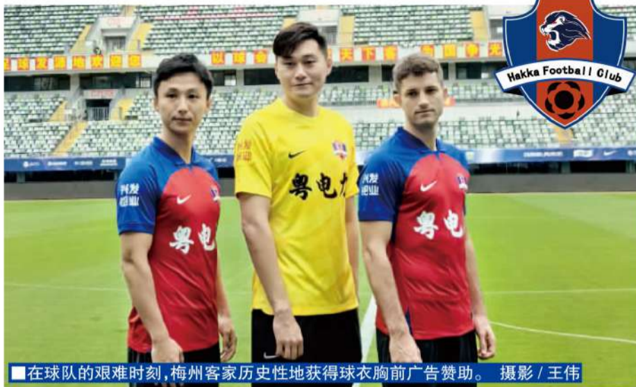
在球队的艰难时刻,梅州客家历史性地获得球衣胸前广告赞助。

可以说,为了梅州客家队的生存发展,梅州当地政府担当起了“宣传员”。正是因为梅州市委、市政府高度重视职业足球健康可持续发展,在省委、省政府的重视下,在省国资委、省体育局的大力推动下,梅州客家俱乐部才得以实现球衣胸前