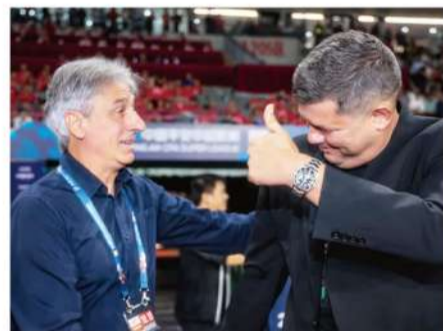
■乔迪过去三年执教浙江队的战绩,折服了包括外教在内的不少中超球队主教练。

我还是更倾向于去思考当下可以解决的问题。未来,是由球队现在的每一步积累而成。说到外援的缺席,我们不是唯一的球队,不少球队都有这样或那样的困难。我们的确有自己的困难,但是没有几支球队是真正容易的。我一直鼓励球员不要抱怨和埋怨,而应该感恩,因为不管怎么难,俱乐部的管理团队和后勤团队从没有放弃过努力,也不消极。他们想尽各种办法去筹集资金支持,没有任何抱怨,没有被动等待,总是给我安慰和希望,也会跟我沟通一些现实中必须接受和理解的情况。