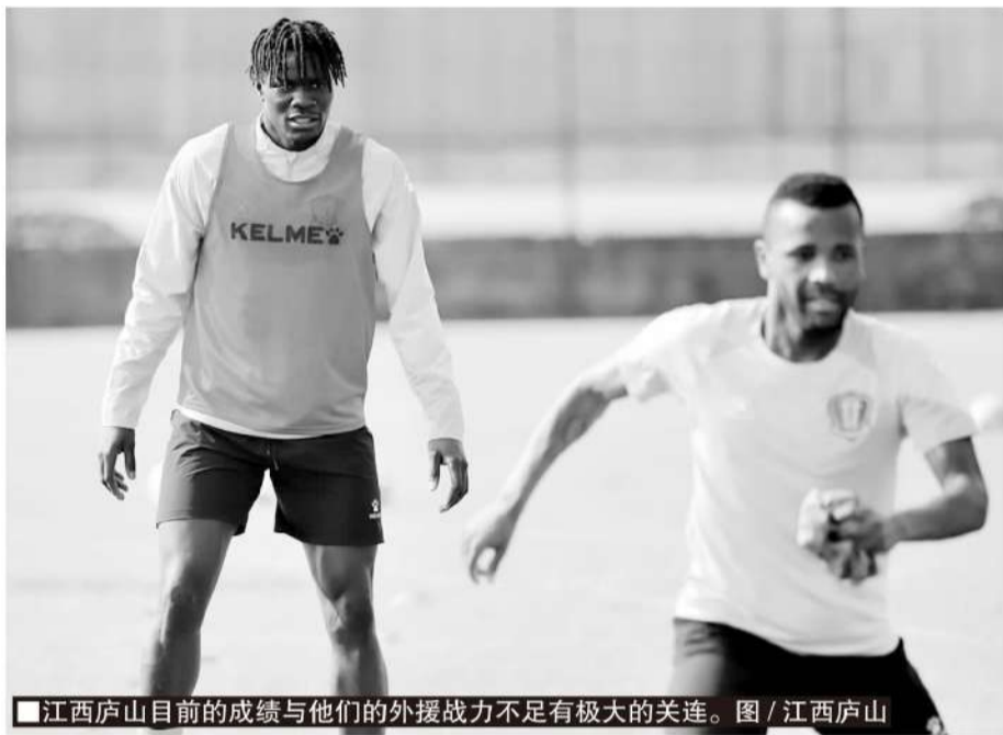
■江西庐山目前的成绩与他们的外援战力不足有极大的关联。

从中甲历年的保级安全线来看,手握30分有望上岸,如今的江西庐山前10轮仅积2分,后20轮要抢下28分,是非一般地难,不过,具体到眼前的保级形势来说,江西庐山又不是无法挽救——距离倒数第三的佛山南狮是6分,离倒数第四的辽宁铁人是7分,也就是说,如果江西庐山来一波两连胜,就能撵上保级区了。还有一个利好是,江西庐山目前的2分,是