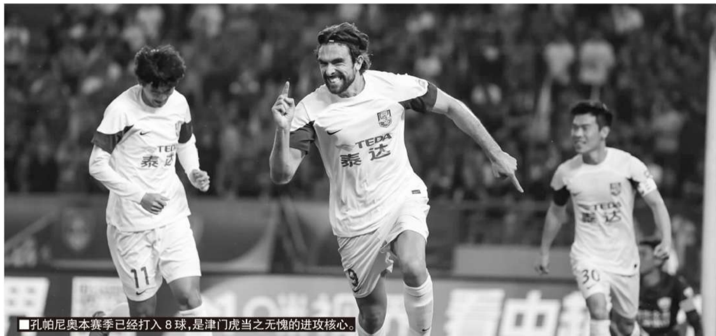
■孔帕尼奥本赛季已经打入8球，是津门虎当之无愧的进攻核心。

提升士气的比赛，证明一个团队的毅力和团结，是能够在一定程度上弥补阵容残缺带来的影响。