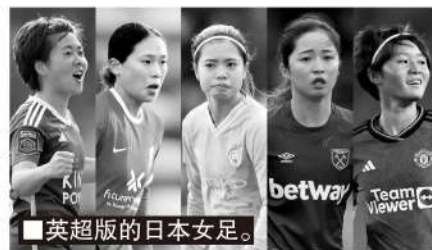
■英超版的日本女足。