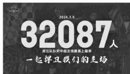
今年3月9日浙江队创造了队史中超主场最高上座率,俱乐部特意制作了庆祝海报。

也许很多球迷还在期待下半年的浙江队能复制上个赛季的奇迹,以不败的姿态彻底逆袭。就目前局势来看,这个可能性不大,但可以肯定的是,浙江队不会放弃,不会因为股改成功的早晚而放逐自我,大家还是会看到浙江俱乐部的努力,看到他们不断地去提供足球除了胜利以外的价值。