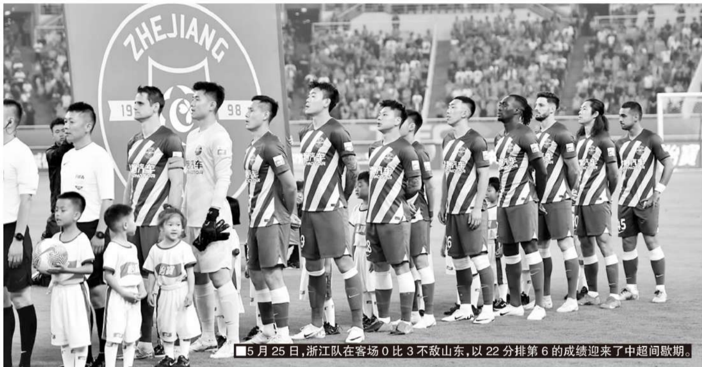
5月25日,浙江队在客场0比3不敌山东,以22分排第6的成绩迎来了中超间歇期。

浙江队将会迎来一周时间的完整假期,乔迪回西班牙休假,外援和中国球员原地调整。6月1日球队将再度集结,备战下半程联赛。俱乐部会为间歇期的引援工作