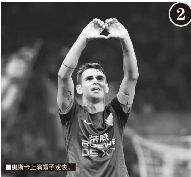
■奥斯卡上演帽子戏法。