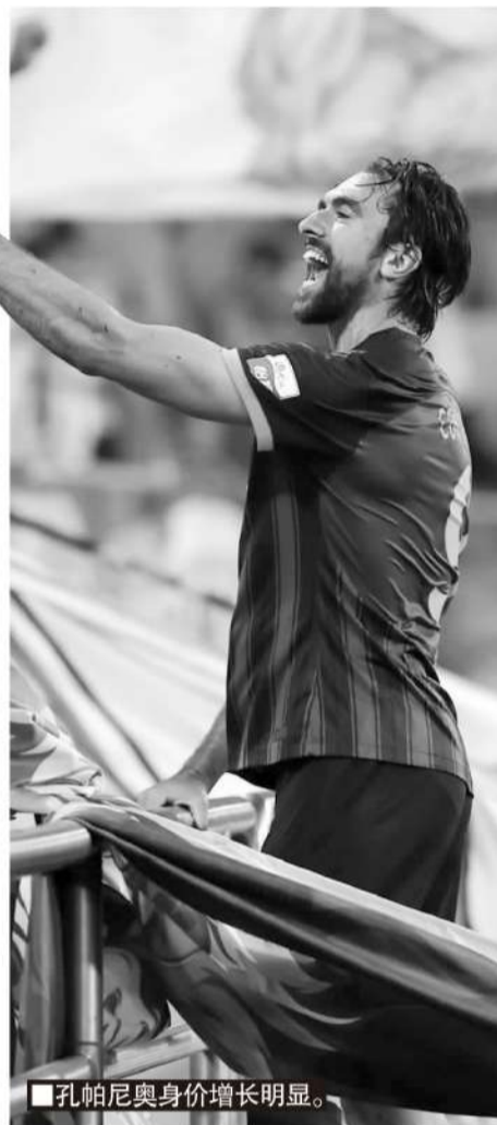
孔帕尼奥身价增长明显。

本赛季至今13场7球10助攻,奥斯卡的数据其实相当不错,他的身价跌了50万,更多是因为“中超水准系数”以及年龄系数的关系。