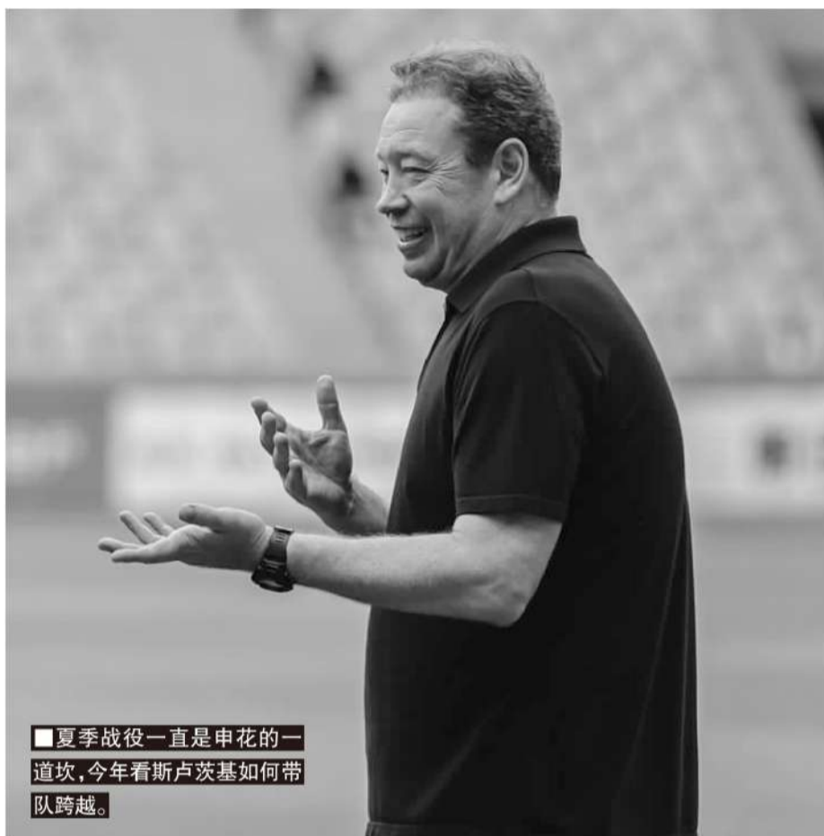
夏季战役一直是申花的一道坎,今年看斯卢茨基如何带队跨越。

申花是在6月2日结束假期重新集结备战的,球队在6月6日和6月9日各安排了一场热身赛,对手是长春亚泰和浙江队。斯卢茨基希望通过四天两战,保持一定的训练强度和比赛节奏。这两场热身赛,联赛中至今没有出场机会的