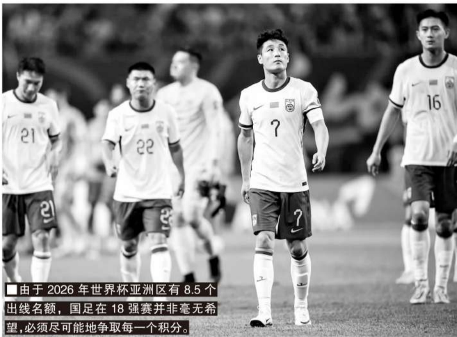
■由于2026年世界杯亚洲区有8.5个出线名额,国足在18强赛并非毫无希望,必须尽可能地争取每一个积分。

不过4年后,亚洲足球二三流球队开始进步,第五档的叙利亚和阿曼前3轮对前三档球队都成功拿分;2022年12强赛第五档的叙利亚,在约旦安曼临时主场逼平第三档的阿联酋,客战前两档的伊朗和韩国,叙利亚也都只是1球小负。而阿曼首战就客场1比0击败第一档的日本爆出大冷门,随后主场0比1小负沙特,在