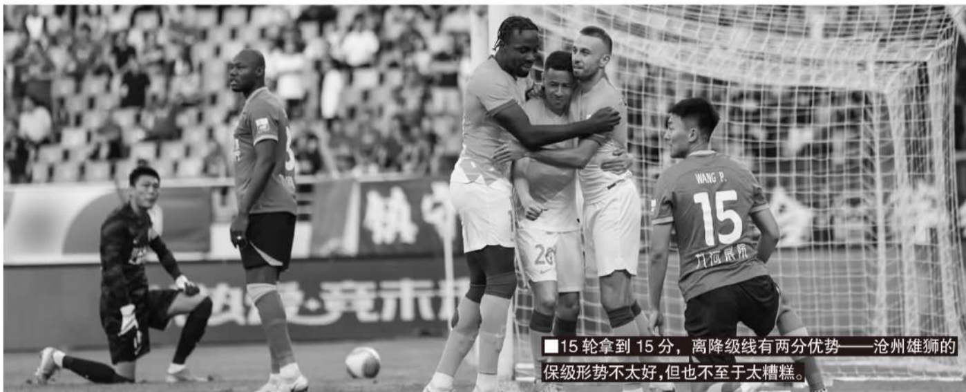
■15轮拿到15分,离降级线有两分优势——沧州雄狮的保级形势不太好,但也不至于太糟糕。

是,关键数据也说明本场表现的差异性,比如说沧州雄狮11次射门只有1次射正,而青岛海牛有5次,沧州雄狮的射正率太低了,要知道在本轮之前,在中超的进球效率榜上,沧州雄狮平均每8.1次射门就能打入1球,而青岛海牛是整个中超进球效率垫底的球队,15次射门才能进1球。此役海牛13次射门打进1球,基本符合他们之前的表现,但沧州雄狮11次射门却只有1次射正,没有进球,有点不正常了。