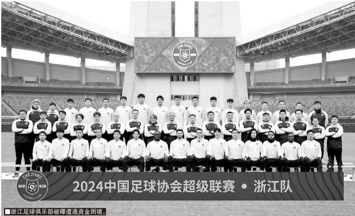
■浙江足球俱乐部被曝遭遇资金困境。

浙江俱乐部,目前也在努力进行二次股改,股改的方向也逐渐清晰,就是省市共建,一家市属国企有望入股,和原本的省属国企浙能共同运营俱乐部。