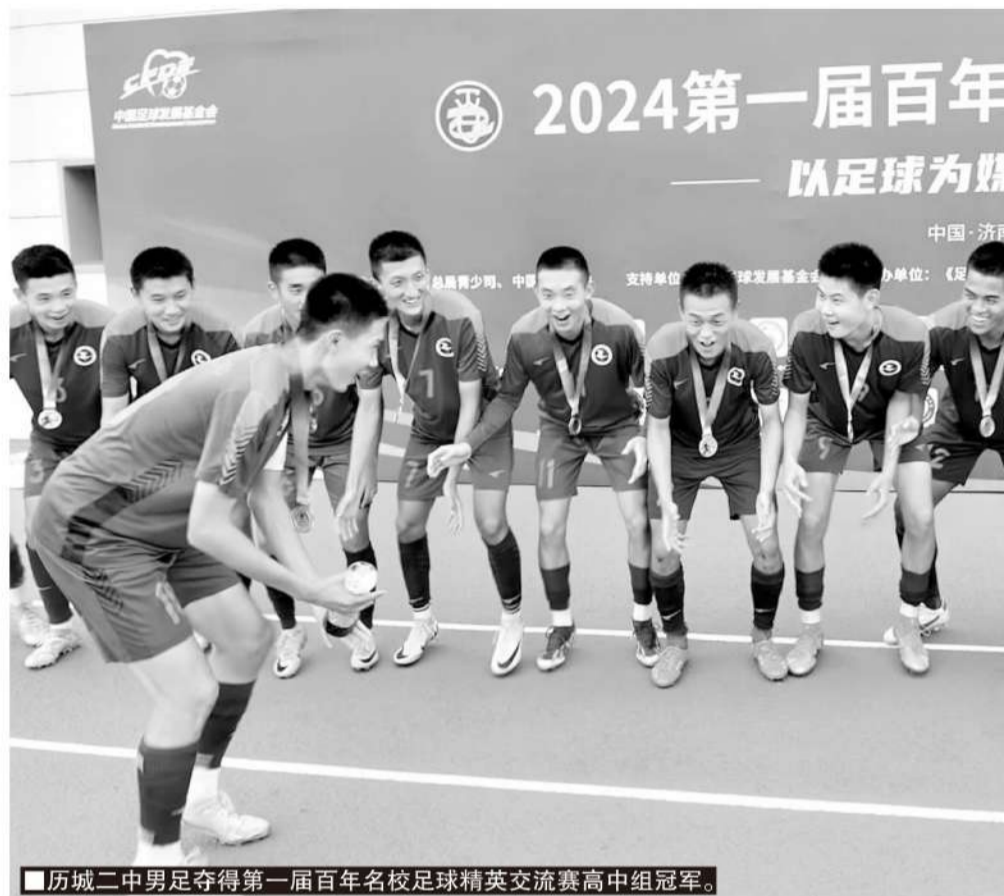
■历城二中男足夺得第一届百年名校足球精英交流赛高中组冠军。

女足的发展有其特殊性,男足发展才是真正的难点。在历城二中女足成功的同时,2022年首届中青赛,历城二中男足便表现不俗,当时历城二中男足完全没有历城二中女足的基础,但在潍坊赛区预选赛中,历城二中小组出线,随后的交叉淘汰赛,点球大战中击败山师附中,晋级中青赛男子U17组全国总决赛,成为参加全国总决赛的39支球队之一。到了今年的第三届中青赛,历城二中男足再次晋级总决赛,同城老对手也是老朋友的山师附中则晋级了