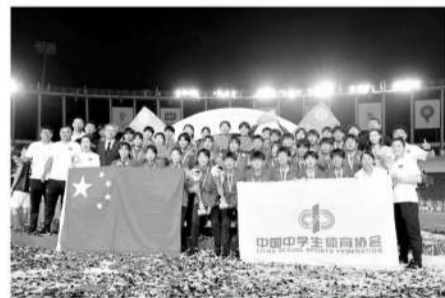
■2023年历城二中女足夺得世界中学生锦标赛女足冠军。