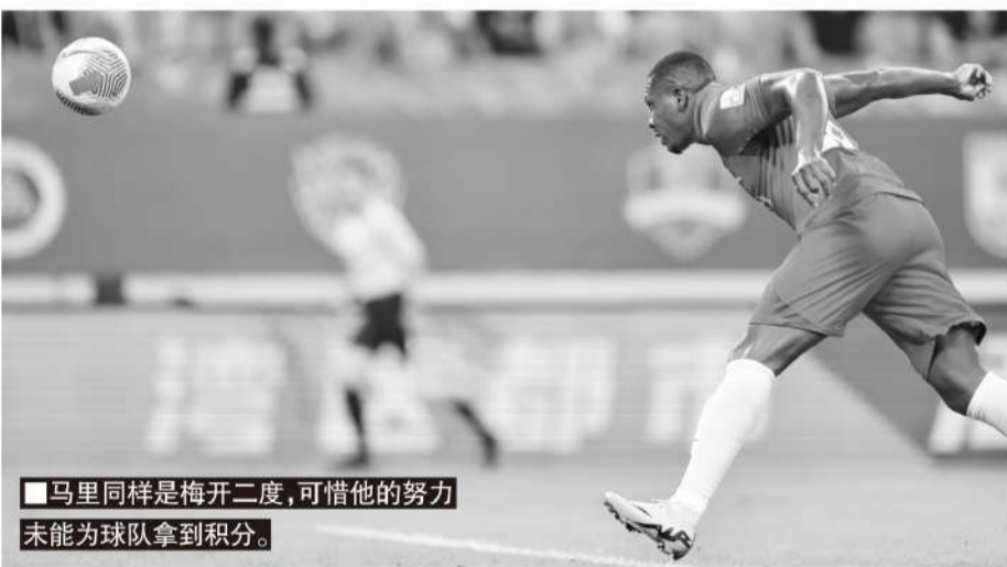
■马里同样是梅开二度,可惜他的努力未能为球队拿到积分。