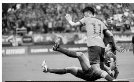
■国安和泰山在股改层面都存在问题。

浙江的情况和河南类似,俱乐部这两年一直谋求混合所有制股改,但进展不顺,原因便是原有的两大股东建业和绿城都无力配资,导致俱乐部陷入困境。河南俱乐部的做法是进行了二次股改,同时在年初大幅缩减开支,以求渡过难关;至于