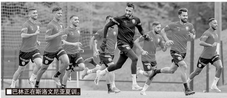
巴林正在斯洛文尼亚夏训。