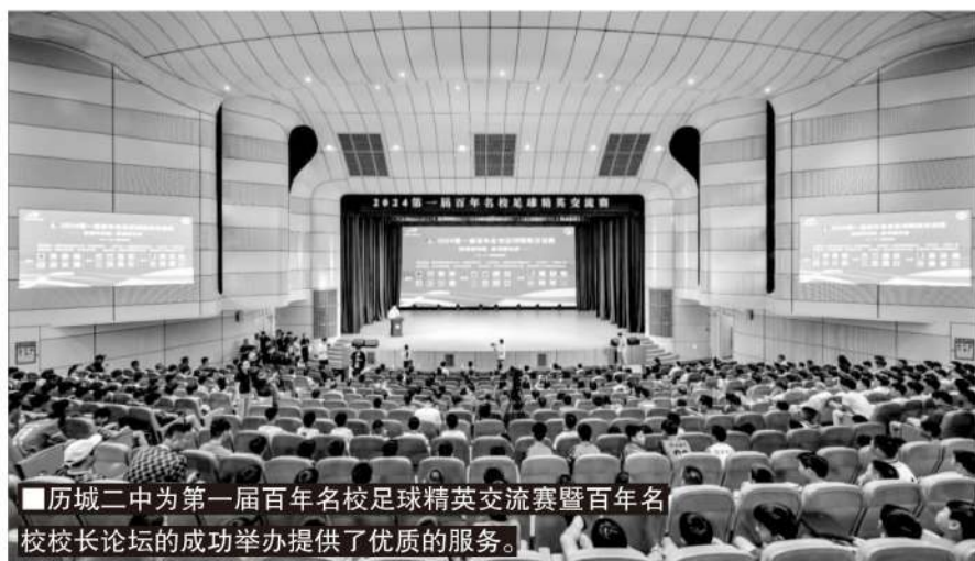
历城二中为第一届百年名校足球精英交流赛暨百年名校校长论坛的成功举办提供了优质的服务。

在结束了首届百年名校杯之后，历城校足办的工作重点转向了中青赛的备战，4支球队出战，必然也会在全国青少年足球赛场上掀起一股历城校园足球风。