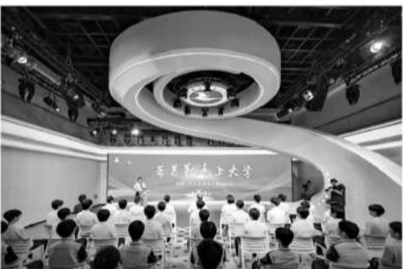
去年9月，历城二中女足9位队员步入大学，学校举行欢送会，让她们带着“勤志”上大学。

历城二中男女组队伍经常要进行冬训、外出比赛等，很大程度上影响到球员们的学习，为此，历城二中制定了极为详尽的学习计划。日常上课时，除了班主任和老师们的监督之外，教练也会不定期地巡查，发现问题，就和班主任沟通，记录下来，定期和家长沟通，及时分享学生的学习情况，关注每一名队员学习习惯的养成。