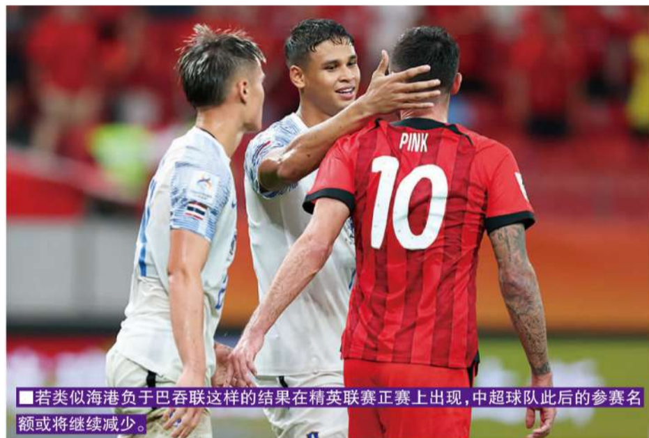
若类似海港负于巴吞联这样的结果在精英联赛正赛上出现,中超球队此后的参赛名额或将减少。

光州FC报满了联赛规定的六个外援,浦项制铁则仅有四名外援。光州FC中锋米凯塔泽,蔚山HD边锋阿拉比泽与山东泰山的卡扎伊什维利一样,都有格鲁吉亚国脚履历。光州FC的阿尔巴尼亚前锋阿萨尼,是亚冠精英联赛东亚区唯一的欧洲杯国脚。光州FC还有身高达1.95米的巴西高中锋若奥·马格诺,实力不容小觑。