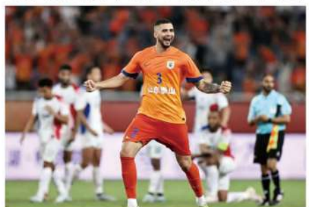
山东泰山晋级正赛能在经济层面获得巨大收益。

集,但J联盟早有国内赛事赛程为亚冠让路的惯例,参加亚冠精英联赛的球队还有来自日本足协的补贴。像横滨水手和川崎前锋这样基本无望从联赛得到下赛季亚冠资格的球队,可以专注于国内杯赛和亚冠。同样,K1联赛和马来超对亚冠的态度也比以往更为重视,赛程让路都有先例。