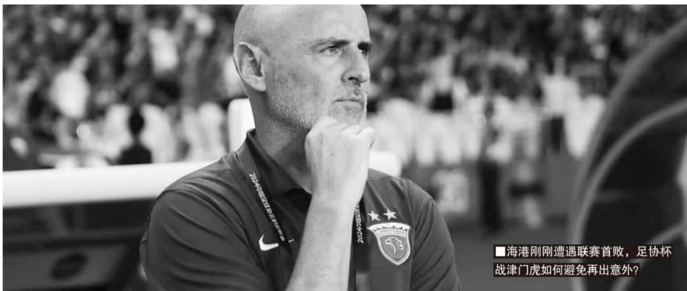
■海港刚刚遭遇联赛首败,足协杯战津门虎如何避免再出意外?

本赛季使用新的进攻型战术思维的同时,海港高层和教练团队都一直在关注球员的身体反应,担心可能会出现伤病,影响球队表现。按照穆斯卡特的要求,海港配备了专门的数据统计团队,为球员的每次训练和比赛做监控,实时向教练组以及医疗团队反应情况。拥有“中超最强医