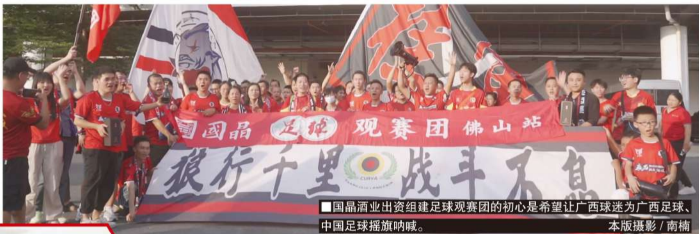
■国晶酒业出资组建足球观赛团的初心是希望让广西球迷为广西足球、中国足球摇旗呐喊。

尽管哈嘹国晶在那场比赛中一度落后，可国晶观赛团在一场人数对比悬殊的球迷比拼中，没有处于下风，他们助威的口号和声音，甚至一度压过了佛山的主场球迷。“进了球场，我们就很兴奋，加上有国晶茶本酒对我们的支持，佛山这个客场就好像在我们的主场平果一样。”提起这