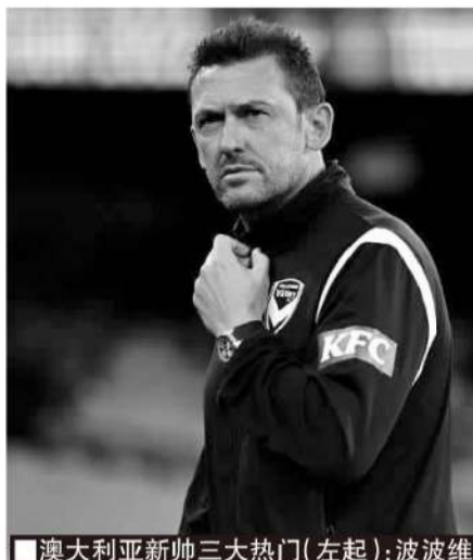
■澳大利亚新帅三大热门(左起):波波维奇,阿洛伊西和克拉莫夫斯基。

英国《每日邮报》提及的候选人还包括曾担任阿诺德助教的穆伦斯汀,他此前曾在曼联辅佐弗格森长达13年;热刺主帅波斯