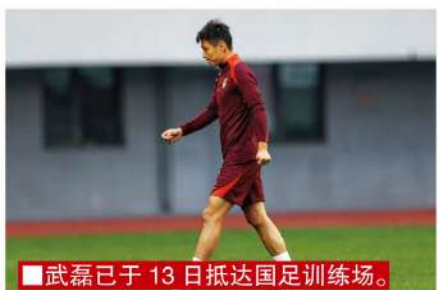
■武磊已于13日抵达国足训练场。

几乎只有两天时间调整,其中还包括长途跋涉的路途耗时。尽管面对密集的赛程和三线作战的转换,海港上下却丝毫不敢松懈。毕竟,无论是中超冠军还是足协杯冠军亦或在亚洲赛场上的好成绩,球队都想尽力争取。