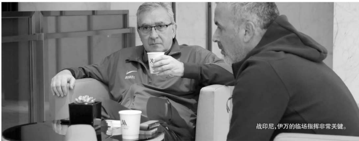
战印尼,伊万的临场指挥非常关键。

目前C组的积分排名也证明,打好与印尼的比赛,国足仍有很大机会。国足前三战输给的日本(9分,第一)、澳大利亚(4