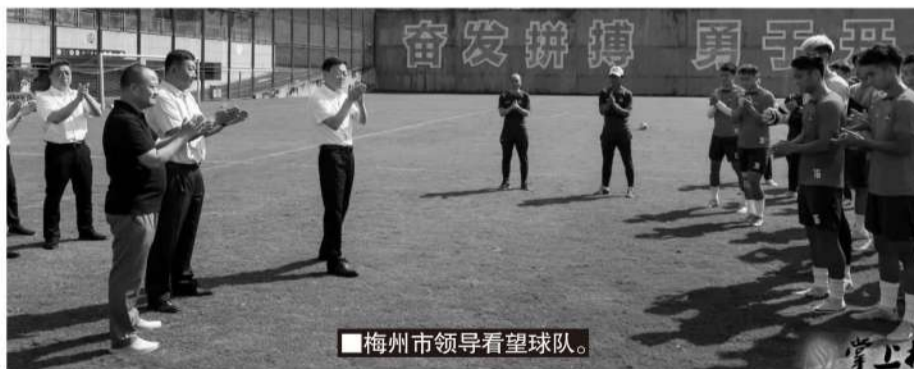
梅州市领导看望球队。

之后，梅州市领导来到中超梅州客家俱乐部训练场，看望正在积极备战的球队，了解球队的训练情况，勉励大家要学会坚持，珍惜自己的足球生涯，在联赛中展示最好的自己。