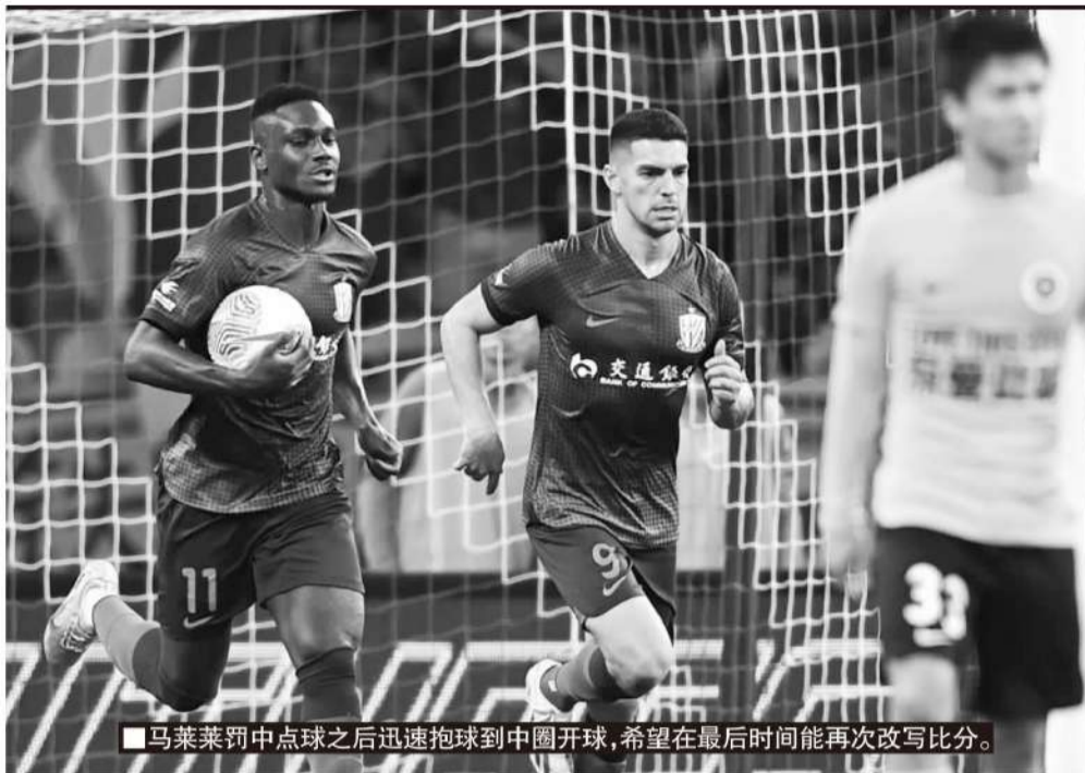
■马莱莱罚中点球之后迅速抱球到中圈开球，希望在最后时间能再次改写比分。