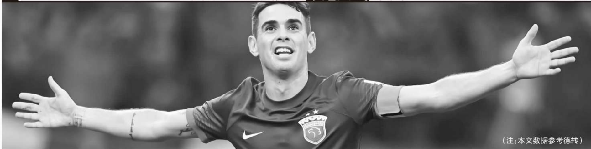
(注:本文数据参考德转)