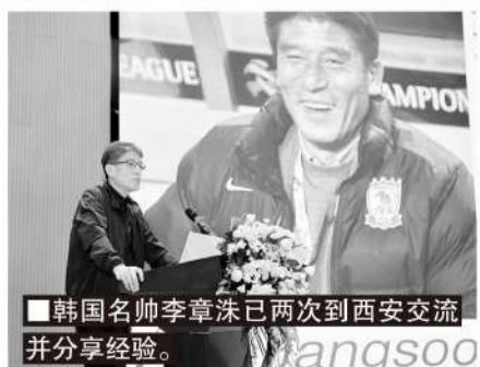
韩国名帅李章洙已两次到西安交流并分享经验。

今年 5 月 31 日，全国足球发展重点城市座谈会上海召开，国务委员谌贻琴在会上指出，建设足球发展重点城市是推动足球改革发展的抓手，要压实政府管足球、抓足球主体责任，深化体教融合，打通青少年球员升学通道等，这次会议为各个足球重点城市指明了方向，明确了任务和角色。各地都开始动了起来。