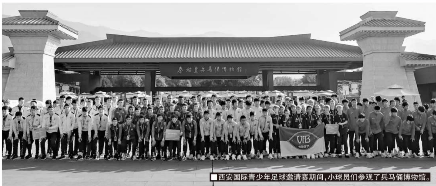
西安国际青少年足球邀请赛期间，小球员们参观了兵马俑博物馆。

从 1979 年起，西安三次入选足球重点城市序列。这一批 16 个足球发展重点城市，西安同样在列。上海会议后，西安从上到下联动起来，由市委市政府相关领导牵头，体育局、足管中心和足协落实，所有人都上紧了发条，围绕足球发展重点城市的要求，对照足球发达地区和国家级高水平人才基地的标准，西安快马加鞭地一项一项将工作落到实处。