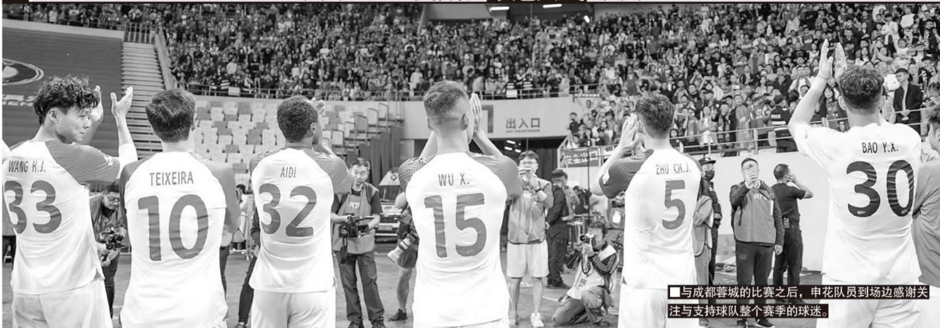
■与成都蓉城的比赛之后，申花队员到场边感谢关注与支持球队整个赛季的球迷。