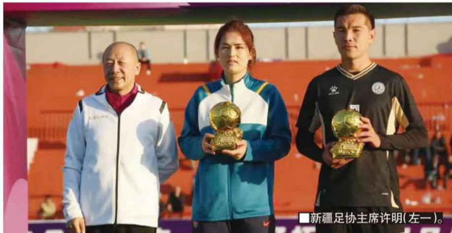
■新疆足协主席许明(左一)。

优秀的身体素质，更重要的则是他们发自内心的热爱，当然也感谢东部地区的青训体系对他们细致的培养。他们的成功，对于新疆青少年的激励作用实在是太大了。