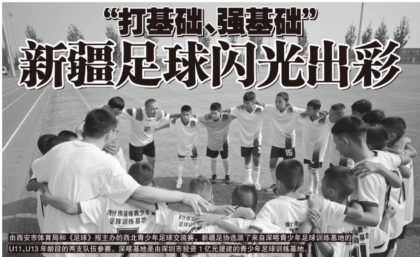
由西安市体育局和《足球》报主办的西北青少年足球交流赛，新疆足协选派了来自深喀青少年足球训练基地的U11、U13年龄段的两支队伍参赛。深喀基地是由深圳市投资1亿元援建的青少年足球训练基地。