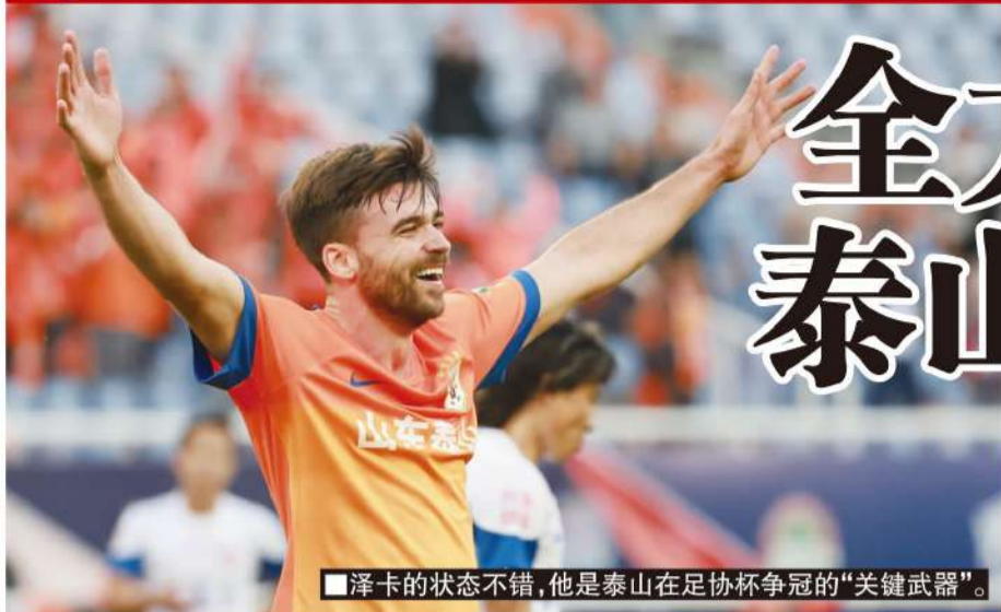
■泽卡的状态不错,他是泰山在足协杯争冠的“关键武器”。