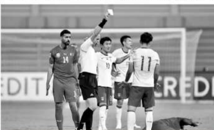
■拼劲是国家队11月18强赛上的亮点。