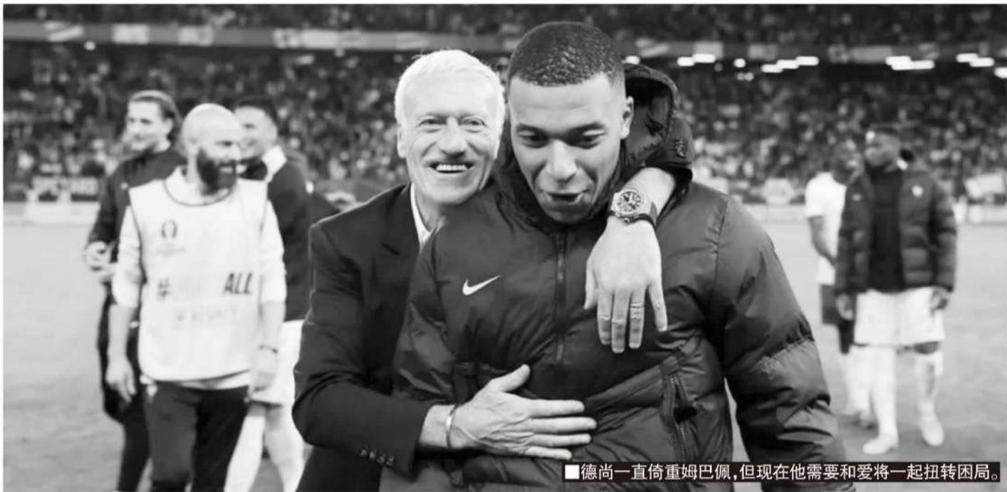
■德尚一直倚重姆巴佩,但现在他需要和爱将一起扭转困局。

记者寒冰报道 作为世界巨星的姆巴佩,身上的标签太多:法国现役头号射手、世界足坛顶流球星、皇马最大牌球星、法国队最大牌球星兼队长……但姆巴佩的成功其实从来都是在世界杯奠定基础的:2018年世界杯一夜成名,也拿到了迄今唯一能够竞争金球奖的大赛冠军;2022年世界杯决赛帽子戏法,虽然最终未能夺冠,但奠定了他的新一代顶流巨星地位。