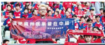
■梅州足球拥有深厚的球迷基础。

关准入的信息。中超联赛是中国足球最高级别的赛事，我们所有人都期待着梅州客家能重新回到这个舞台。这么多天我们一直在等待着，对俱乐部而言，中超和中甲的准备是不一样的，投入也是不一样的。在1月6日看到职业联赛的准入名单之后，俱乐部马上组织球队为2025赛季联赛做准备。