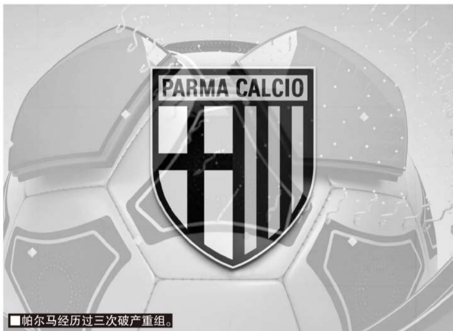
帕尔马经历过三次破产重组。

俱乐部先破产重组，新俱乐部从业余联赛起步。新俱乐部进入职业联赛后再购买原俱乐部的商标等“标识性资产”，完成“重生”继承。意甲的佛罗伦萨、帕尔马、那不勒斯、都灵、威尼斯，基本都是经由第二种情况得到了原俱乐部的历史“遗产”。第二种情况新俱乐部继承权需要资金保障，确保能收购原俱乐部商标等历史遗产，还需要地方足协、政府和意大利足协共同评估，是否具备继承原俱乐部的条件。