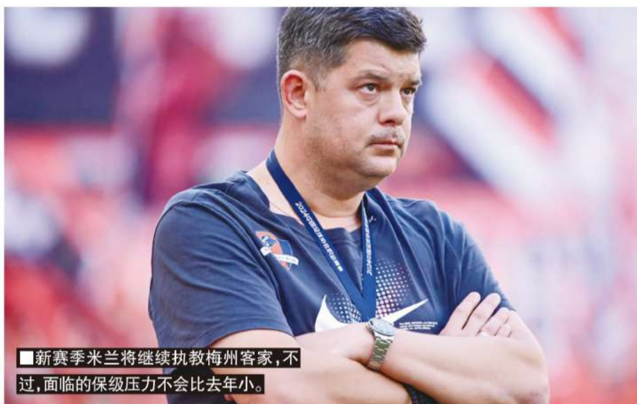
■新赛季米兰将继续执教梅州客家,不过,面临的保级压力不会比去年小。

从前两个赛季的表现来看,梅州客家的球员年龄结构偏大,所以新赛季的主要任务就是完成球队的新老交替工作。2024赛季结束后,梅州客家阵中有多