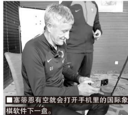
塞蒂恩有空就会打开手机里的国际象棋软件下一盘。

是的,是我授权我在桑坦德的一位好朋友、一位很好的记者朋友写的,把我整个职业生涯都写进去了,如果有中文版就好了。