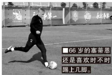
■ 66岁的塞蒂恩还是喜欢时不时踢上几脚。