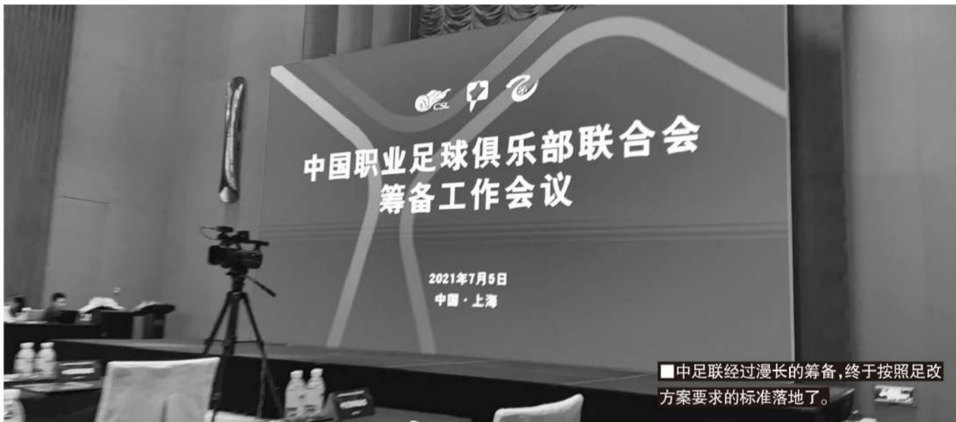
■中足联经过漫长的筹备,终于按照足改方案要求的标准落地了。

商务运营和财务监管是相辅相成的,一切都是为了保障联赛和职业俱乐部的健康,进而保障联赛和职业俱乐部的可持续发展。这两项工作包含多个层面,每个层面都是难点,这才是中足联正式成立之后需要发力的方向。