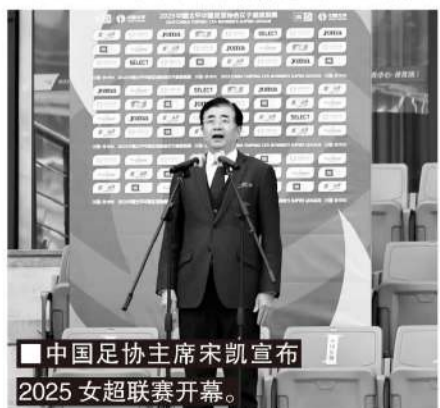
中国足协主席宋凯宣布2025女超联赛开幕。

山东省足管中心主任、山东省足协理事会会长胡斌介绍了山东女子足球的发展情况:目前山东女子足球有1支女超、2支女甲和4支女乙球队,同时校园足球女足发展迅速,省内排名靠前的12所高中