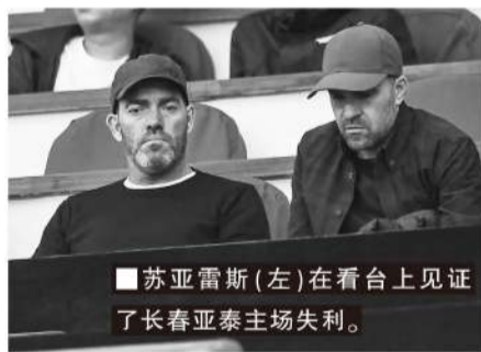
■苏亚雷斯(左)在看台上见证了长春亚泰主场失利。

置,包括技战术层面、思想层面以及教练员层面的调整。虽然长春亚泰目前排名榜尾,但球队还是拥有相当一部分有实力的球员,他希望通过训练和比赛,在技战术层面完成对长春亚泰的改造,并希望球队在接下来的比赛中得到提升。