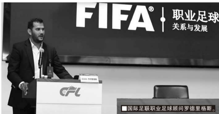
国际足联职业足球顾问罗德里格斯。

5月28日,西甲联盟主席特巴斯进行了《足球产业的可持续发展与西甲打击盗版的实践》主题分享;西甲联盟企业事务总经理戈麦斯在《西甲财务公平法案介绍》中先后介绍了西甲版权开发和保护的