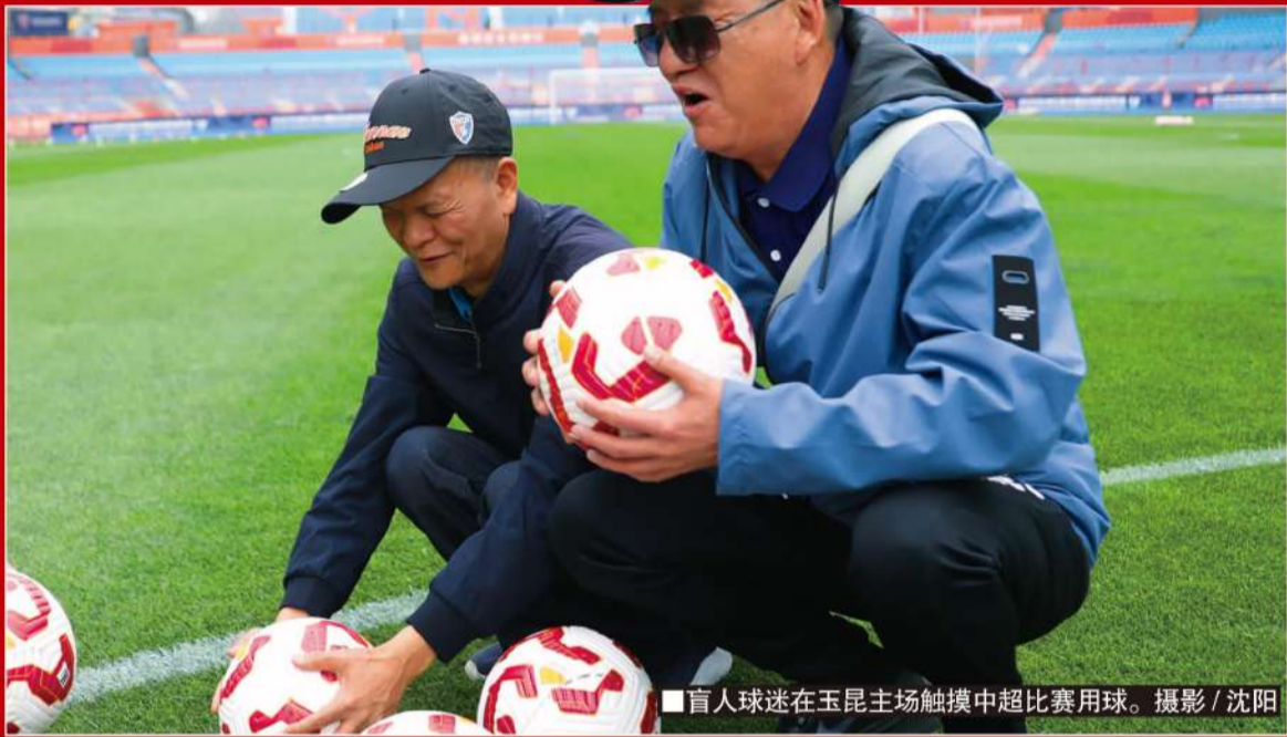
盲人球迷在玉昆主场触摸中超比赛用球。

他们聚在一起,不只是交流技艺。作为玉溪市盲人协会的志愿者,他们想帮助更多的盲人朋友——在黑暗、模糊的世界里,足球让他们找到了更多的快乐和勇气,也让他们平淡的人生并不平凡,赤忱的内心满怀激情。