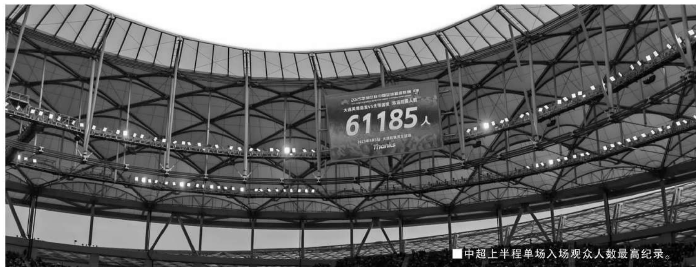
■中超上半程单场入场观众人数最高纪录。