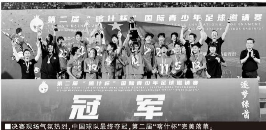
■决赛现场气氛热烈,中国球队最终夺冠,第二届“喀什杯”完美落幕。

中国青少年足球的赛事体系,从参赛球队的实力划分,可以分为普及型赛事、青训赛事和精英青训赛事。普及型赛事一