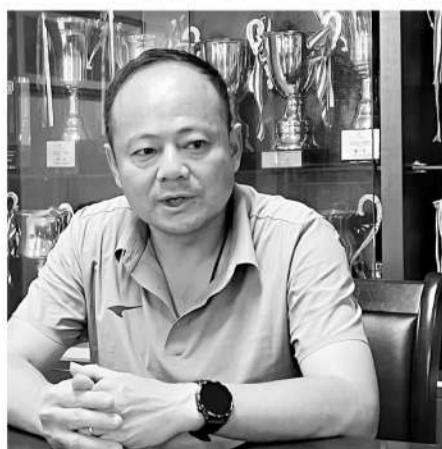
张智教练以不同身份获得三块金牌。

获得十五运会群众比赛足球项目七人制男子甲组冠军的广东队以广州求信队为班底组建,邀请广州市足协梯队教练范智