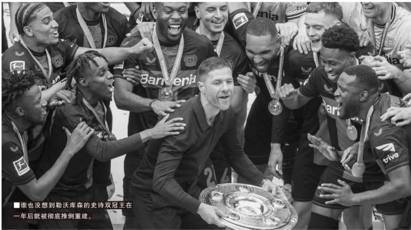
■谁也没想到勒沃库森的史诗双冠王在一年后就被彻底推倒重建。

一年多前,勒沃库森以不败战绩获得德甲和德国杯双冠,今夏,功勋少帅走了,10核心号走了,另外还有6名双冠赛季的绝对主力走了。勒沃库森主动选择了重建之路,就像游戏里,重新起一个新号来玩。勒沃库森“起号”的过程,在职业足坛并不多见,因此具有相当高的参考意义。