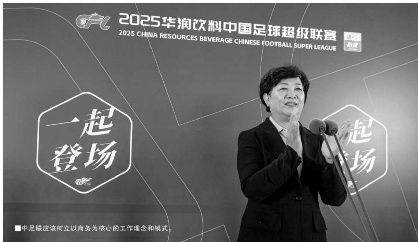
■中足联应该树立以商务为核心的工作理念和模式。

中足联树立以商务为核心的工作理念和模式。中足联的成立是2025年中国足球的大事之一，当前中足联成立后两个重点工作方向，其一是竞赛体系，包括