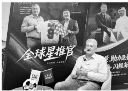
传奇球星苏克出任绿城体育全球星推官。

足球对苏克有着特别的意义。“很简单,足球给了我一切,我也希望把我的一切回馈给足球。CGT绿城体育是最好的人造草坪公司,作为CGT绿城体育全球星推官,我相信我们一定能一起赢得更多场地项目,赢得更大的市场。”苏克说。