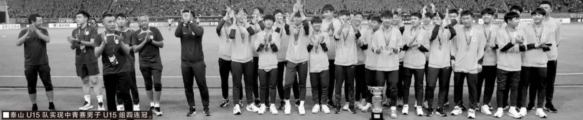
■泰山U15队实现中青赛男子U15组四连冠。

记者陈永报道 9月14日晚,第四届中青赛青少年足球联赛(下简称中青赛)男子U13组在浙江俱乐部中泰基地落下帷幕,恒大足校U13夺冠。两天前,男子U19组决出冠军,泰山U19队在点球大战中击败武汉三镇,成功卫冕并实现中青赛四连冠。此前的男子U15组,泰山U15队夺冠,同样获得中青赛四连冠。目前,男子组只有U17组尚未决出冠军。