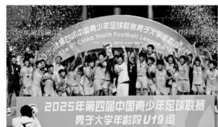
■泰山U19队夺得男子U19组冠军。

综上所述,社会青训机构逐渐向业余俱乐部和职业俱乐部过渡,高等院校的青训体系逐渐建立并完善,是未来中国青少年足球发展的方向所在。