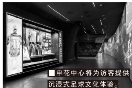
■申花中心将为访客提供沉浸式足球文化体验。

“申花中心”预计将于春节前正式面向公众售票开放。谷际庆表示:“我们期待申花的激情与荣耀,融入城市肌理,成为市民生活的一部分。”申花期待更多前来上海旅游的国内外游客,能够到“申花中心”参观打卡,感受体育的激情与魅力,从而打破传统体育场馆的时空限制,打造一个365天持续运营的城市体育文化新地标。