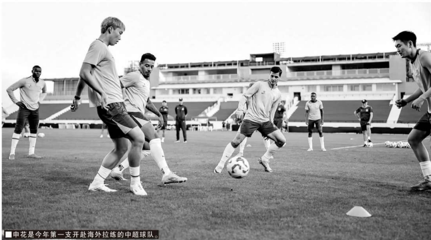
■申花是今年第一支开赴海外拉练的中超球队。

总共丢35球,是中超丢球比较少的队伍之一,仅比最少的成都蓉城多7球。和上赛季联赛冠军海港相比,申花失球数少9球。总体而言,申花的防守端虽然不及2024赛季稳固,但放眼整个中超,防守依然还是比较不错的。